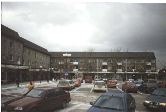
K-märkt: Blackebergs centrum i Stockholm, ett nästan orört affärscentrum med omisskännlig 50-talsatmosfär och neonskyltar.