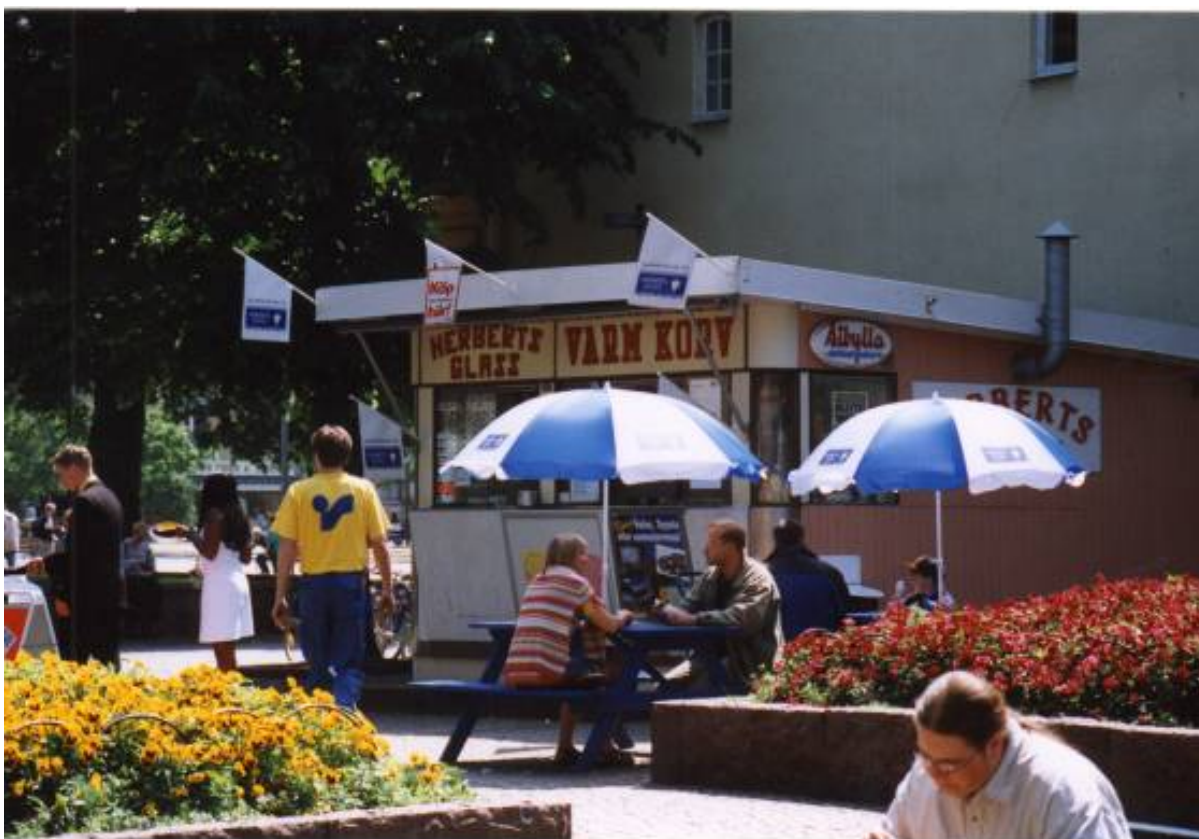
K-märkt: Korv- och glasskiosk i Brunnsparken i Varberg som funnits där i över 60 år och som kommunen önskar flytta. Protester samlade över 7 000 namnunderskrifter, men kiosken fick ändå flytta.

Här är det uppenbart att de som skickat in förslag till k-märkning saknar berättelserna om modernitet, om det moderna samhällets framväxt och dess fysiska spår. Eftersom förslagsställarna till stor del själva tillhör de generationer som växte upp under och strax efter andra världskriget handlar utgör de en grupp som således saknar sin egen uppväxths historia och miljöer i kulturmiljöarbetet. RAÄ:s satsning på Det moderna samhällets kulturarv är i detta perspektiv helt rätt.