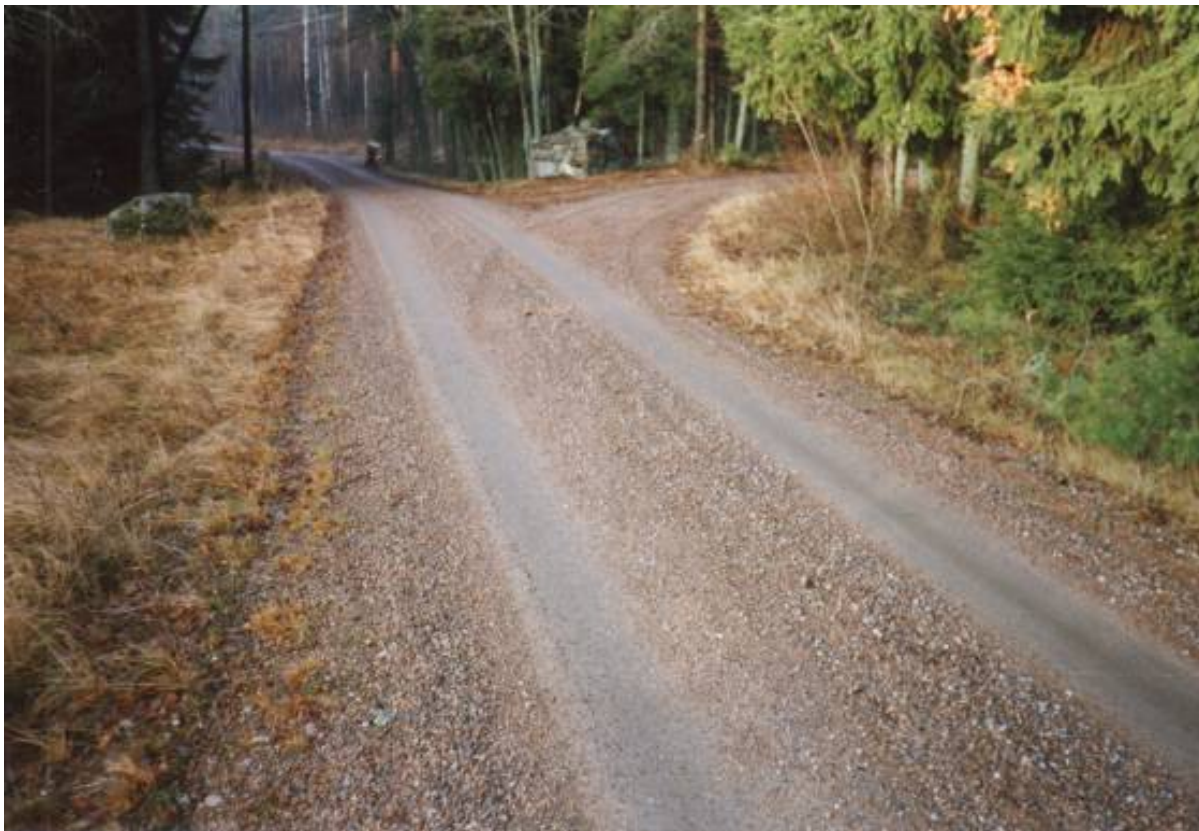
K-märkt: Den gamla kungsvägen mellan Växjö och Jönköping är mycket gammal och användes fram till 1950-talet. Idag underhålls den ideellt av förslagsställaren

Estetiska motiv till bevarande är också vanligt förekommande i kampanjmaterialet. Dessa är som regel mycket personliga – förslagsställaren vill k-märka en byggnad, ett stycke natur eller liknande för att hon eller han tycker att det är så vackert. De estetiska motiven används oftast i positiv bemärkelse i kampanjen, men det finns också exempel på motsatsen.