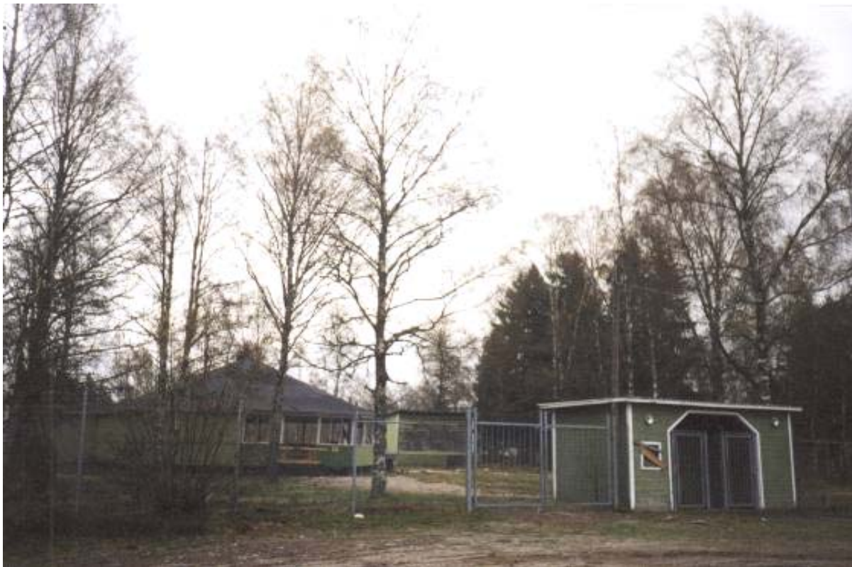
K-märkt: Granbacka danspaviljong i Bäckefors har besökts av många kända artister.

Vad är det då för k-märkningar som går att känna igen från K-spanarna? I Svenska folkets egen k-märkning återfinns en relativt stor andel förslag till k-märkningar som rör frisersalonger med originalinredning från 1950-talet, konditorier där såväl inredningen som innehavaren funnits i 60 år, bensinpumpar, lokala posthus där de boende hämtar sin post sedan ett halvsekel tillbaka, dansbanor, folkets hus och folkets parker och så vidare.