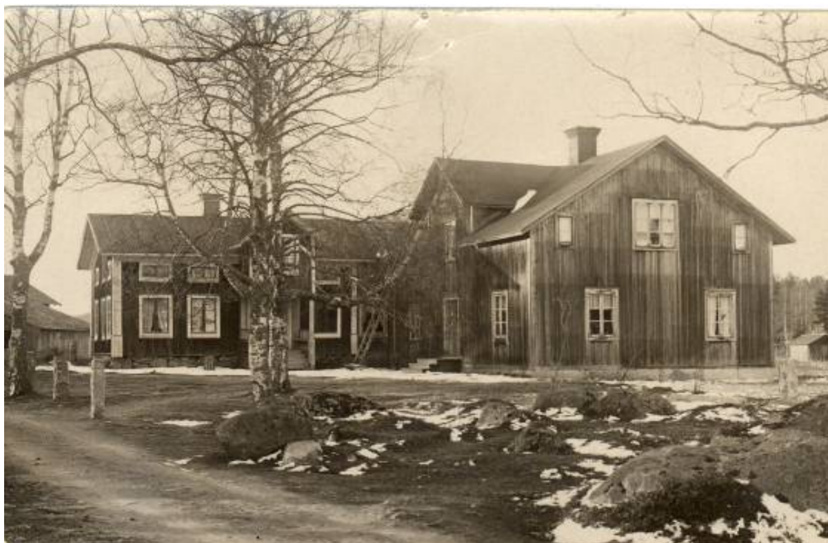
K-märkt: Ett torp som är förslagsställarens barndomshem – i bra skick, med snickarglädje och av god kvalitet.

Dessa ”hinder” bör ha inneburit att en relativt intresserad förslagsställare krävdes för att genomföra hela processen och verkligen få iväg k-märkningen till kulturdepartementet före den 10 juni 1998. Vi känner redan till att mer än två tredjedelar av de förslagsställarna som angett sin ålder var 49 år eller äldre 1998, vilket är den ålderskategori som är mest intresserade av bevarande av kulturarv enligt andra undersökningar. Det kan det vara så att de som sände in förslag till Svenska folkets egen k-märkning tillhör den skara i samhället som redan före kampanjen var intresserade av historia, minnen, kultur och liknande. För att få ett representativt urval av befolkningen hade tillvägagångssättet för hela kampanjen behövt vara ett annat. Det hade, som tidigare nämnts, kunnat uppnås genom att tillämpa sådana metoder som används i medborgarundersökningar av mer kvantitativ karaktär.