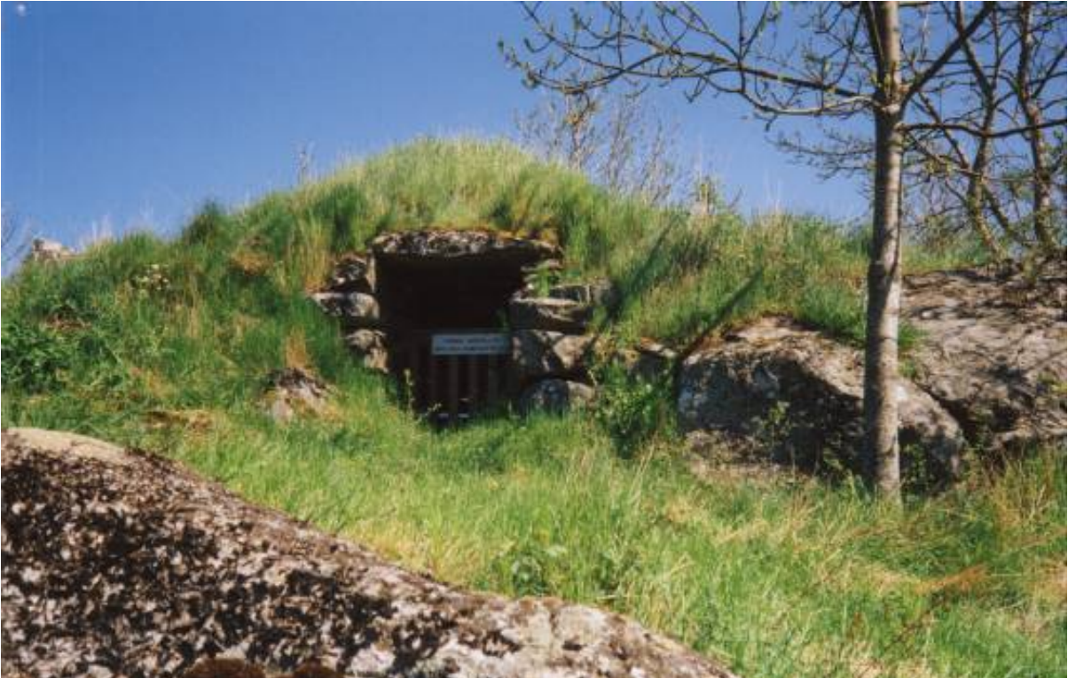
K-märkt: Jordkällare i Morlanda socken på Orust som skänkts till hembygdsföreningen. Rymmer omkring 40 tunnor potatis