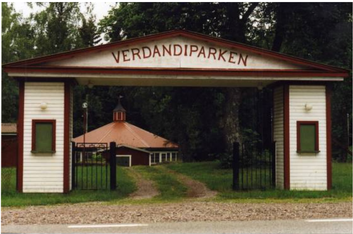
K-märkt: Verdandiparken i Älgshult, välbevarad helhetsmiljö.

den verksamhet som bedrivs eller har bedrivits i den fysiska miljön. Det materiella är således spår av en verksamhet eller en funktion, vilket i sin tur ansluter till de berättelser som verksamheten och dess fysiska uppenbarelse förmedlar. Det är precis detta som K-spanarna gör så skickligt i sina böcker och TV-program: de visar på och förmedlar berättelserna kring samtidigt, berättelser som ofta har anknytning till fysiska miljöer, ting eller upplevelser som många kan känna igen sig i.