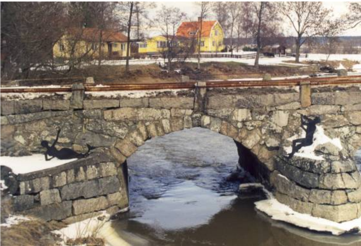
K-märkt: Stenbro över Örsundaån som borde k-märkas, eftersom den är unik och i behov av restaurering för att inte förfalla.