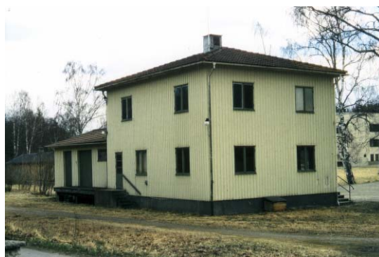
K-märkt: Borggårds hållplatsstuga i mycket välbevarad funkis övertogs av Postverket sedan den smalspåriga järnvägen mellan Norrköping och Örebro lagts ned. Visar på den nya tidens intåg i den gamla bruksorten.

Vad är det då för k-märkningar som går att känna igen från K-spanarna? I Svenska folkets egen k-märkning återfinns en relativt stor andel förslag till k-märkningar som rör frisersalonger med originalinredning från 1950-talet, konditorier där såväl inredningen som innehavaren funnits i 60 år, bensinpumpar, lokala posthus där de boende hämtar sin post sedan ett halvsekel tillbaka, dansbanor, folkets hus och folkets parker och så vidare.