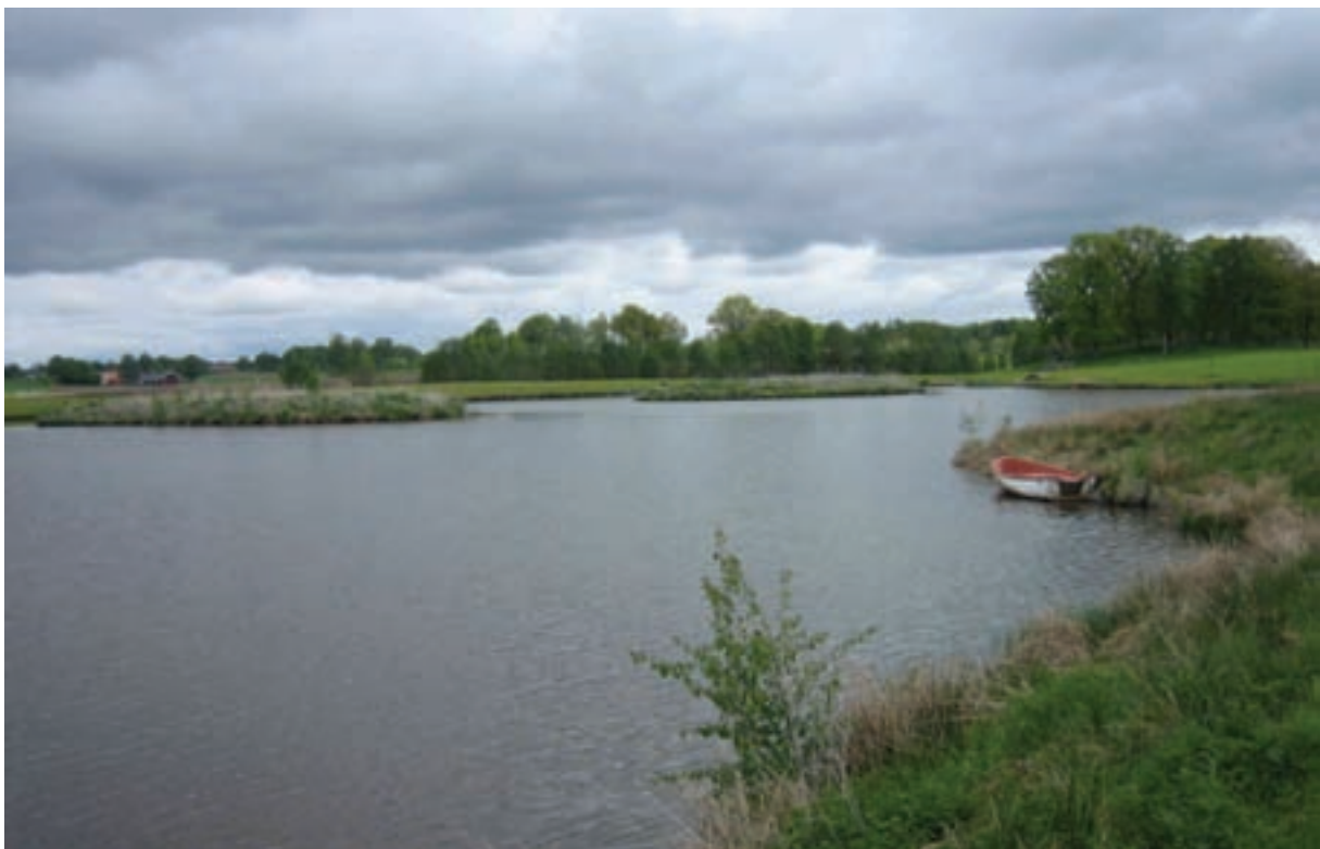
I denna känsliga kulturmiljö är utformningen viktig. En bättre lösning hade varit att dämna befintliga vattendrag och skapa översvämmade ytor, inte en djupgrävd sjö med öar som runda tårter.