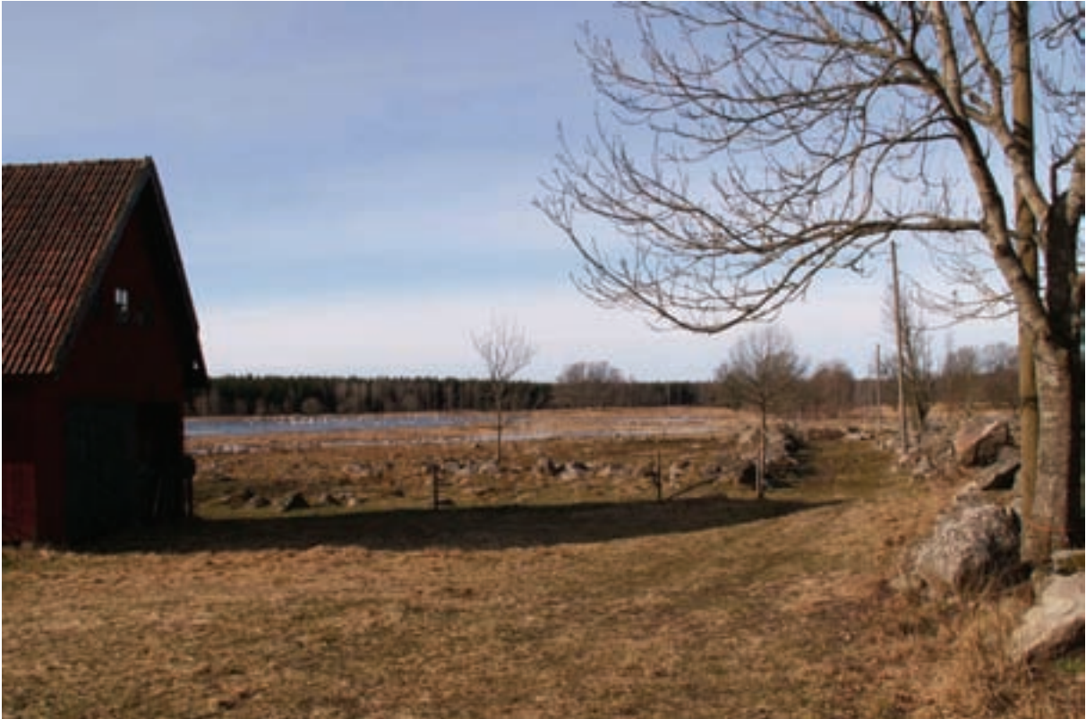
Historiskt karaktärslandskap med lång kontinuitet och höga kulturvärden. Genom försiktig dämning har ett äldre mer vattenrikt landskap återskapats.