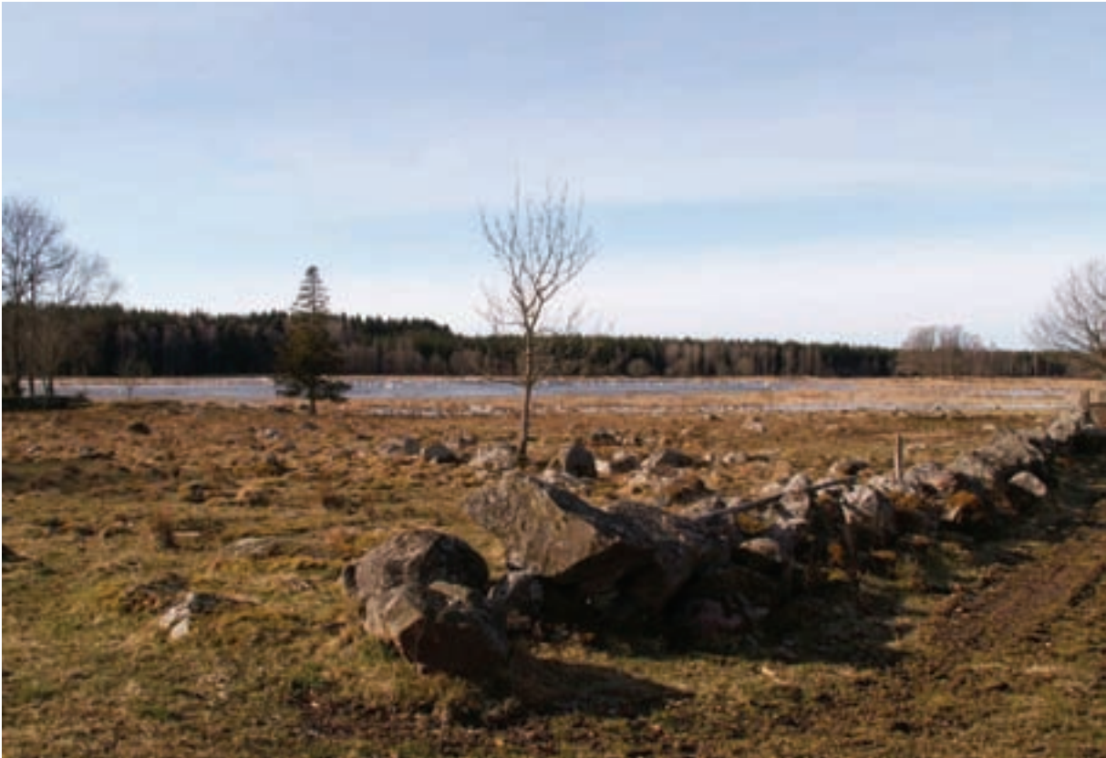
Äldre landskapselement liksom våtmarksområdet hålls öppet och välhävdat genom bete. Landskapets höga kultur- och upplevelsevärden bevaras på detta sätt.