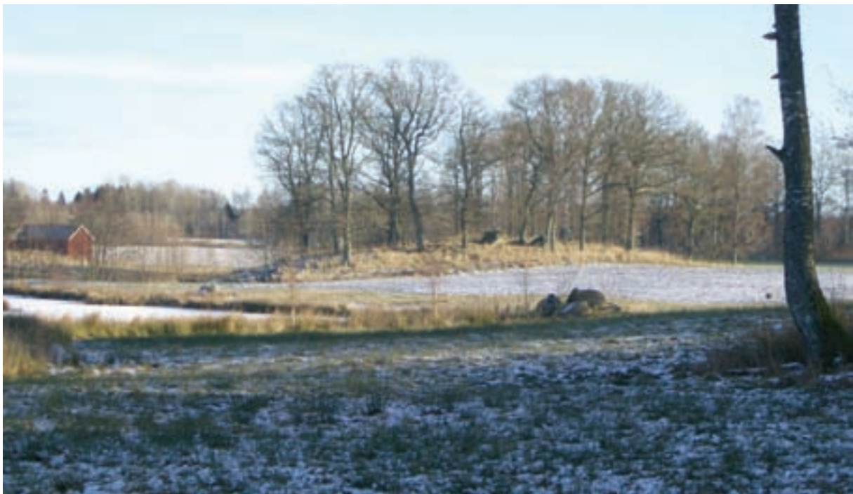
Anläggningen har kommit oacceptabelt nära kända fornlämningar.