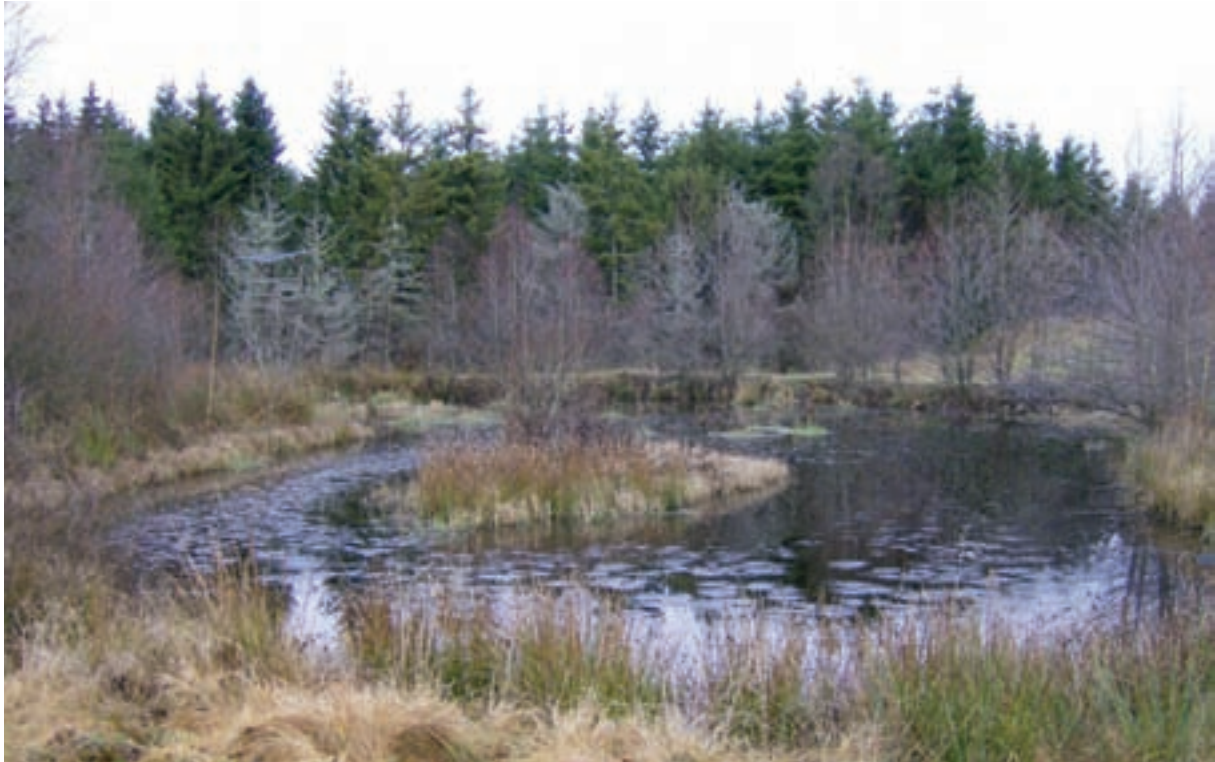
Bitvis konstgjort intryck med runda öar och dominerande vallar mellan våtare partier. Träd- och busksly bör tas bort.