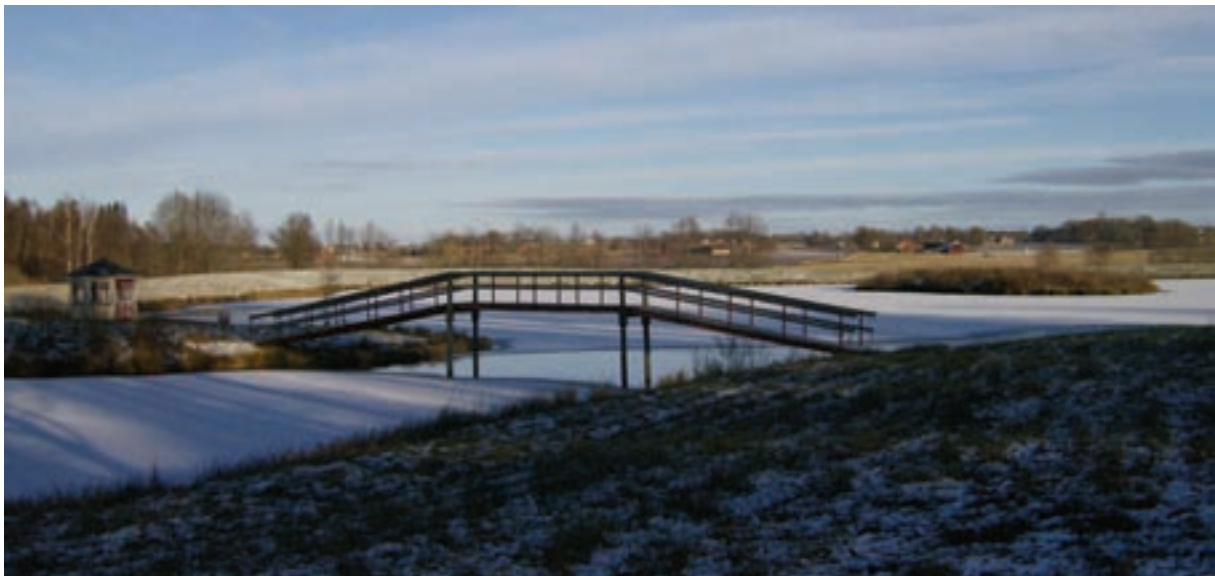
Storskaligt anlagd våtmark i fornlämningsrik centralbygd. Den parkinspirerade utformningen med bro, lusthus och konstruerade öar står i skarp kontrast till det ålderdomliga odlingslandskapet. Här hade ett samråd kunnat bidra till en bättre utformning.