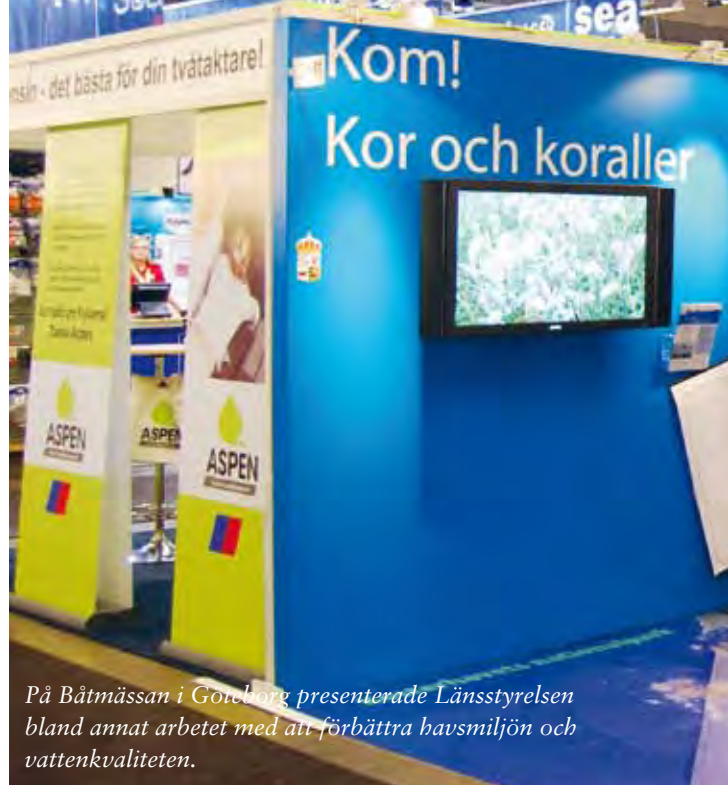
På Båtmässan i Göteborg presenterade Länsstyrelsen bland annat arbetet med att förbättra havsmiljön och vattenkvaliteten.