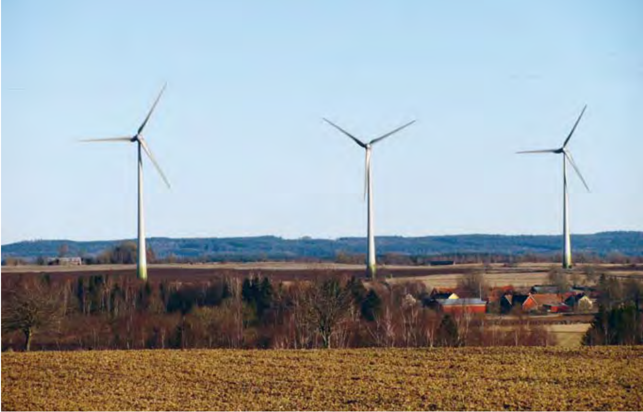
Skörstorpsverken i Falköpings kommun med Hökensås i bakgrunden.