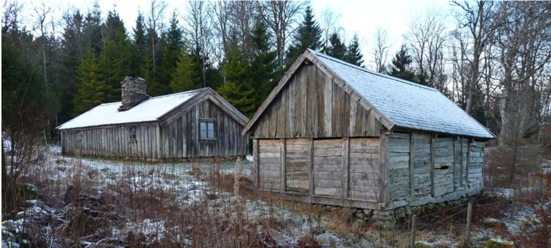
VG 15 (till vänster) och VG 16 till höger.

Kommentarer: En samling av tre mycket intressanta gamla byggnader. Hög biodiversitet men svårinventerat p g a rimfrost vid besöksstillfället.