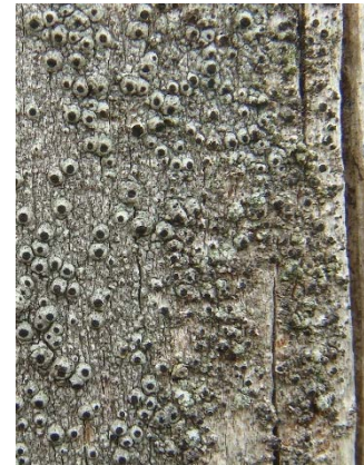
Närbild av grå ladlav

När ett stängsel behöver bytas ut är det positivt om man låter de äldre ekstolparna stå kvar. De nya stolparna kan sättas bredvid de gamla. Gamla ekstolpar som står upp är mycket viktiga för grå ladlav. Ska grå ladlav kunna flytta över till de nya stolparna måste dessa vara av obehandlad ek, gärna sågade och fyrkantiga i tvärsnitt.