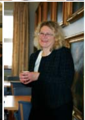
Seminarium på Länsstyrelsen i Malmö våren 2003 där deltagarna från projektgrupperna träffades och utbytte erfarenheter.