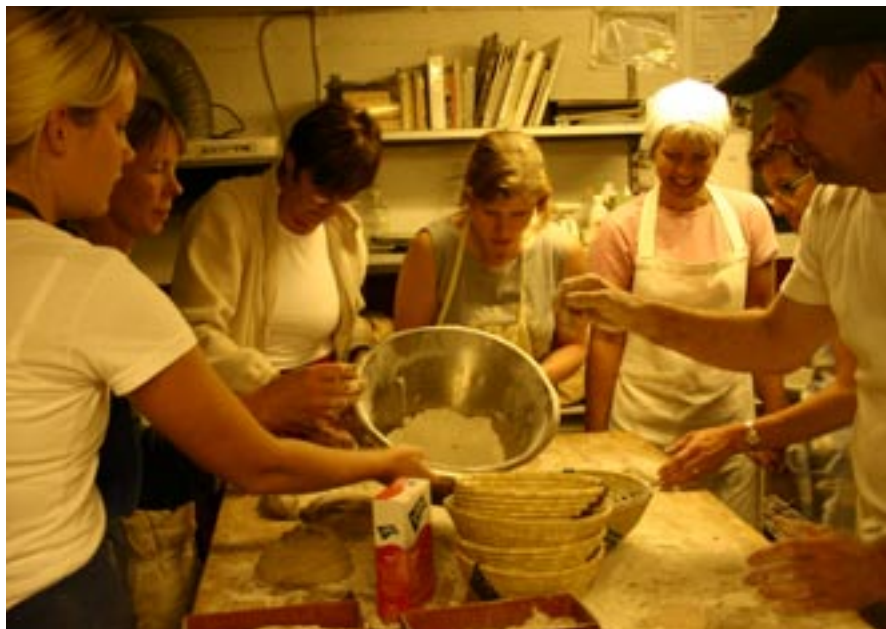
Konsten att baka surdegsbröd – en möjlig intäktskälla ur flera synvinklar.

Kursen "Baka och sälja bröd" är ett samarbete mellan Hushållningssällskapet och Länsstyrelsen i Halland. Det är en av många kurser arrangerade i syfte att bidra till en levande landsbygd.