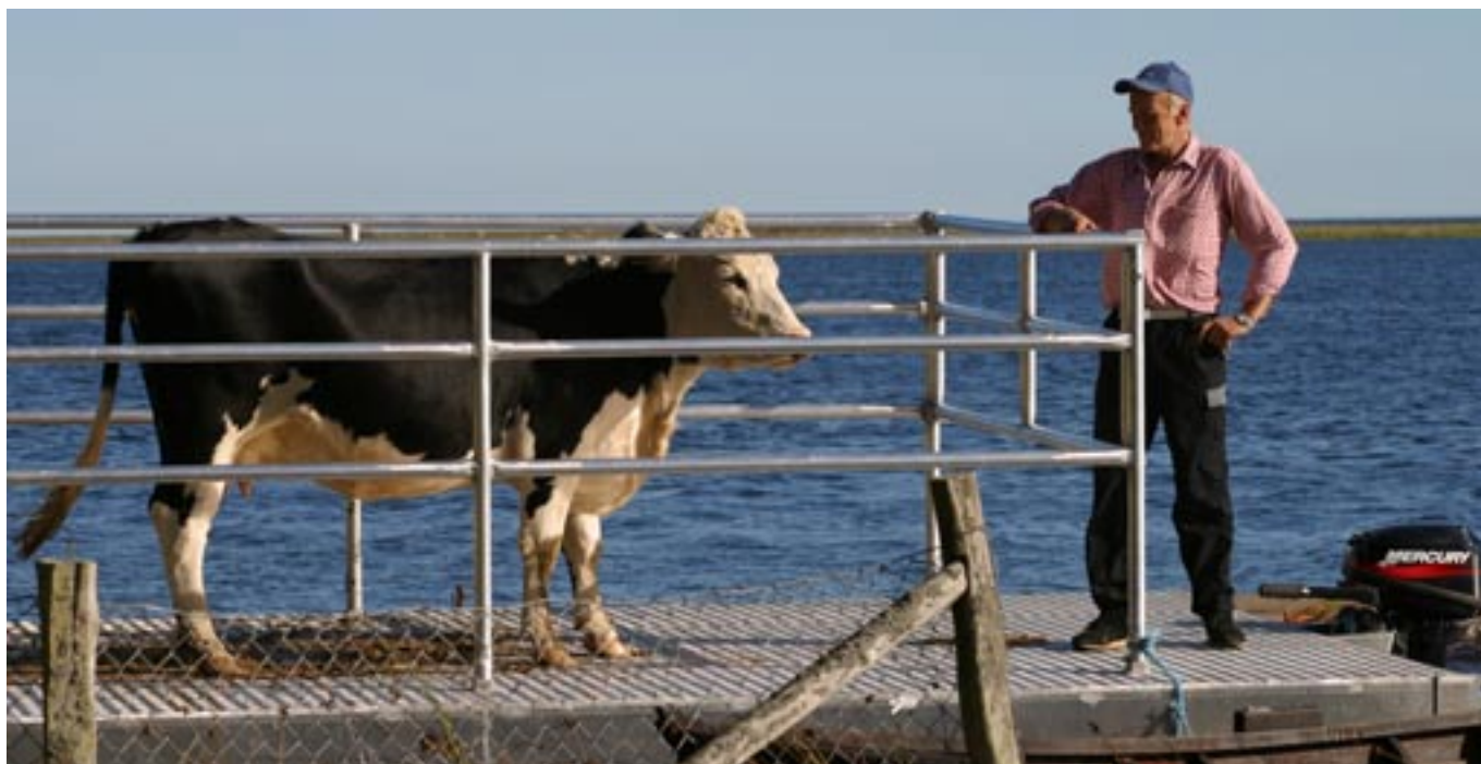
Flotten som innebär möjlighet för öppna ölandskap.

– De är en förutsättning för det öppna landskapet och om vi också i fortsättningen vill ha svensk mjölk och svenskt kött.