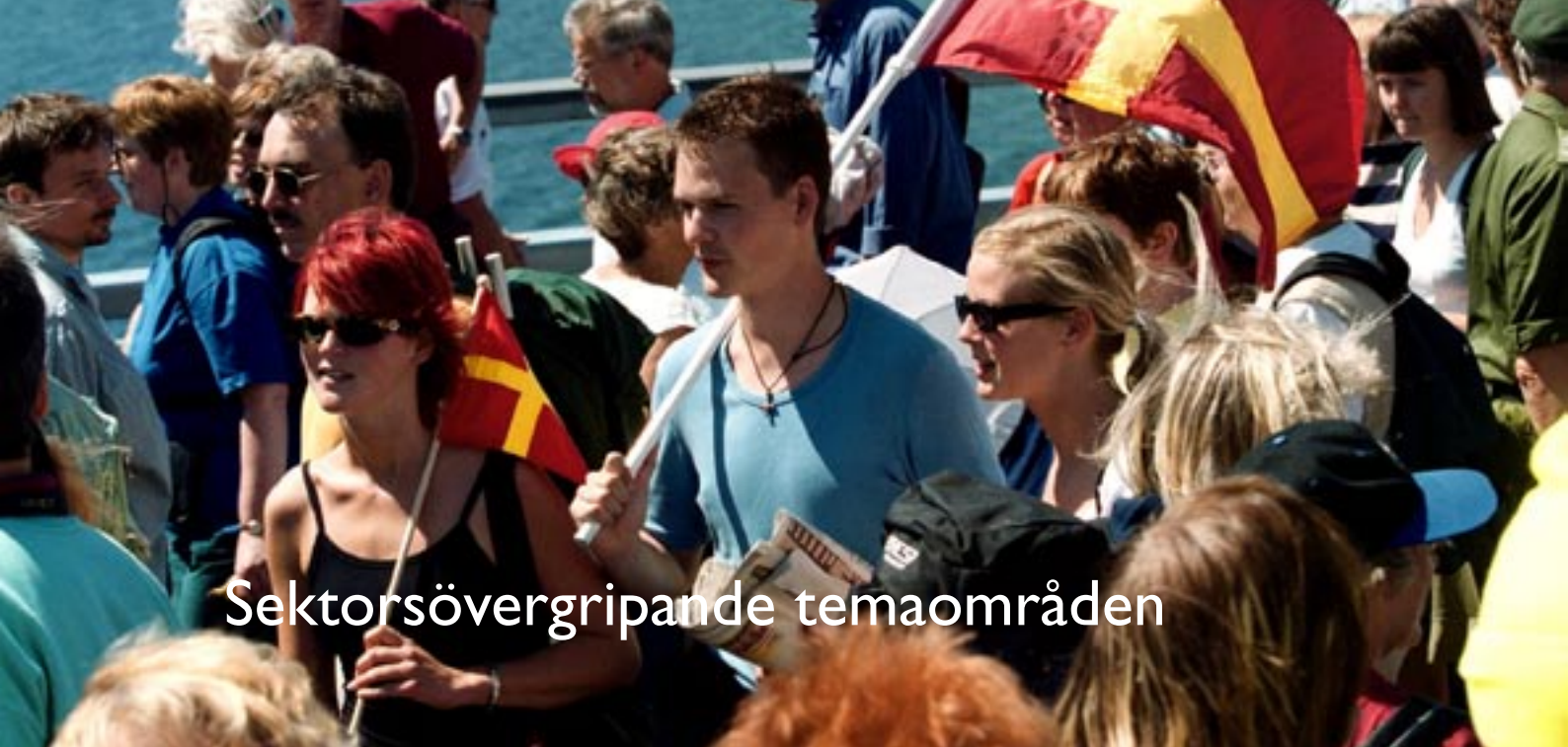
Foto: Torbjörn Carlsson/Sydsvenskan Bild. Personerna på bilden har inget med texten att göra.