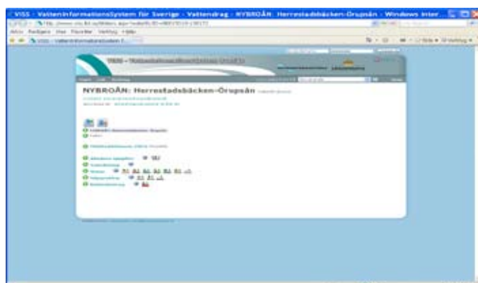
Utdrag ur VISS.