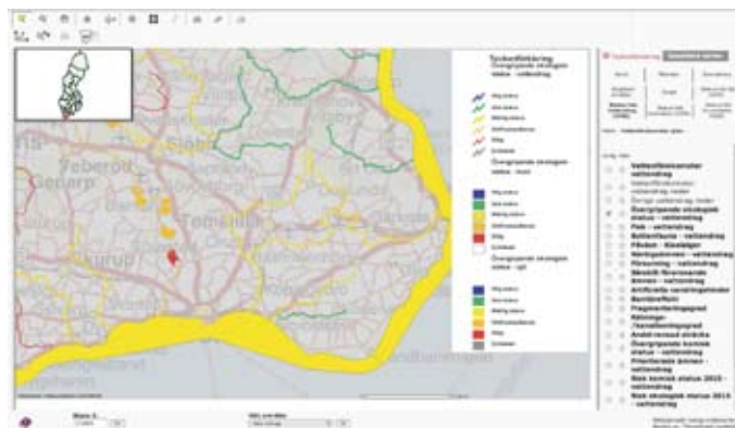
Bild från vattenkartan som visar ekologisk status i sjöar, vattendrag och kustvatten i sydöstra Skåne.

I figuren till höger visas ett exempel från vattenkartan där statusklassningen visas för några sjöar, vattendrag och kustvattenförekomster. Genom att kryssa i de rutor för den information man behöver om statusklassningen och därefter uppdatera kartan syns en kartbild där klassningen visas med färger. Med hjälp av informationsverktyget går det att klicka på en vattenförekomst och få fram en ruta med namnet på vattenförekomsten. Därefter har man möjlighet att via en länk till VISS (databasen VattenInformationsSystem Sverige) få mer information om vattenförekomsten. Här redovisas vattenförekomstens MKN och detaljerad geografisk information. Genom att klicka sig vidare i rutan ”skapa rapport” kan man få information om miljöproblem och bedömningar av vattenförekomsten i form av en pdf-fil.