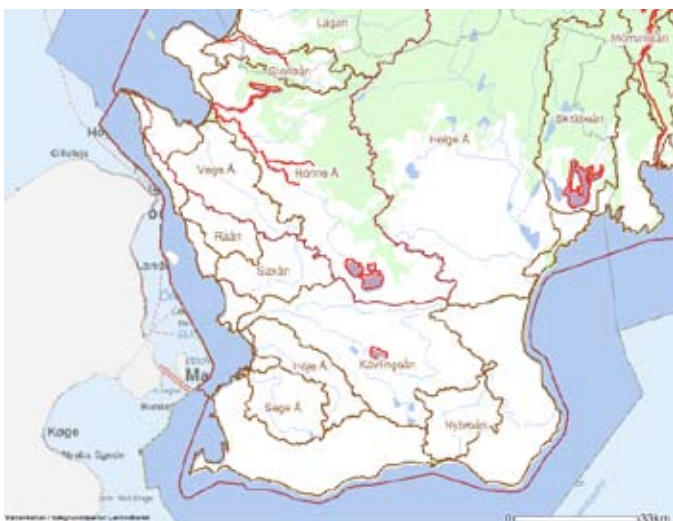
Sjöar och vattendrag i Skåne som omfattas av fiskvattendirektivet.

MKN ska uppfyllas senast inom 5 år från att förordningen ska tillämpas på vattnet. Då Skåne beviljats dispens av naturvårdsverket bör dessa normer vara uppfyllda i januari 2011. För mer information om tillståndet i de vatten där miljö kvalitetsnormer för fiskvatten finns hänvisas till Länsstyrelsens hemsida under miljöövervakning