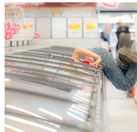
Energieffektiva frysdiskar är en av många investeringar som möjliggjorts av Landsbygdsprogrammet.

För att möjliggöra en fortsatt skötsel av marker med höga biologiska värden. I områden med högt rovdjurstryck, främst varg, har det funnits möjlighet att få ersättning för att sätta upp rovdjursav-visande stängsel. Vi har främst