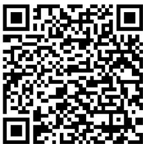
Figur 1: QR-kod som leder till metodens webbplats

Kopplat till metoden finns även en webbsida 1 som riktar sig till medarbetare hos företag inom post- och paketverksamhet, Polismyndigheten, kommuner samt Tullverket. Den innehåller bland annat information om illegala föremål, rutiner för informationsdelning samt information om arbetet med metoden.