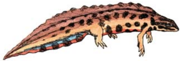
Mindre vattensalamander Triturus vulgaris