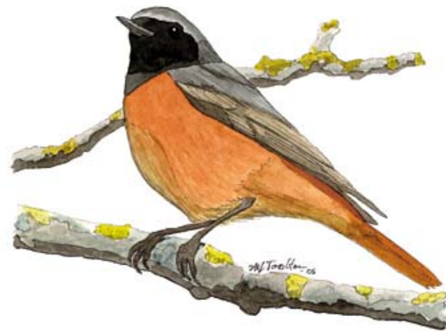
Rödstart Phoenicurus phoenicurus