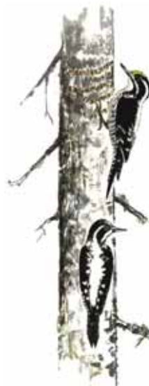
Tretåg hackspett Picoides tridactylus

Skogen är hänglavrik med många arter skägg- och tagellavar. I den fuktiga kanjonbotten förekommer sällsynta arter som skuggblåslav, trådbrosklav och lappranunkel. Lavskrika är vanlig i området och här finns också tretåig hackspett, tjäder och goda gnagarår tornfalk och pärluggla. Området är rikt på naturupplevelser och har du tur kanske du kan få se någon överflygande kungsörn eller spår av björn eller lodjur.