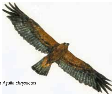
Kungsörn Aquila chrysaetos

Förutom den mäktiga kanjonen finns andra spännande formationer i reservatet. Norr om Uvtjärnen finns flera blockgrottor av olika storlek. Ett par av de större genomströmmas av en liten bäck. I kanjonens mitt ligger nästa grottområde. Det är en rasbrant, ett bergskred, med en håla där is ligger kvar ända in i juni månad. Trånga gångar leder vidare till små salar i fem våningar. Grottans totala längd är ungefär 70 meter. I kanjonens norra del finns fler blockgrottor. Där kan du via smala gångar komma ner tio meter under jorden.