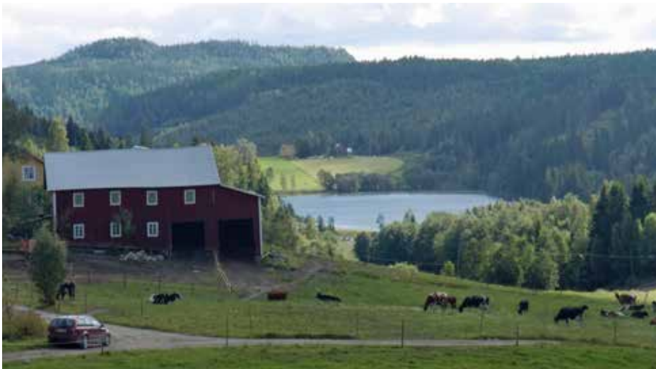
Kompensationsstödet är viktigt för många lantbruksföretag i vår region.