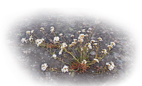
Strandtrav ( Cardaminopsis petraea )