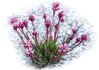
Fjällnejlika ( Lychnis alpina )

I klippskrevor växer arter som krypven, fjällnejlika, fackelblomster, knutnarv och strandärt. Även strandtrav som i Sverige bara finns vid Ångermanlandskusten. Längre upp täcks hällarna av lavar och mossor. I sänkor och skrevor har tallar fått fäste samt olika risväxter som ljung, kråkbär och mjölon. Högre upp från vattnet blir tallskogen tätare.