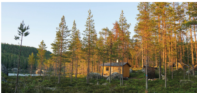
Stugan vid Kniptjärn är nybyggd och ligger fint vid tjärnen.

Vintertid kan du ta dig hit med snöskoter. Tänk på att skoterkörning endast är tillåten längs skoterlederna. Dessa kan även nyttjas med skidor eller snöskor. Vägen till parkeringarna plogas dock inte vintertid så du behöver själv hitta någonstans att ställa bilen.