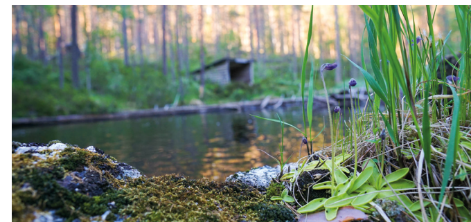
Tätört vid Kniptjärnsbäcken. Vindskyddet är ett av flera i reservatet.

även i bäckar i Helvetesbrännan. I området finns många naturreservat. Förutom Vattenån angränsar naturreservaten Flistersjöskogen och Lokmyran.