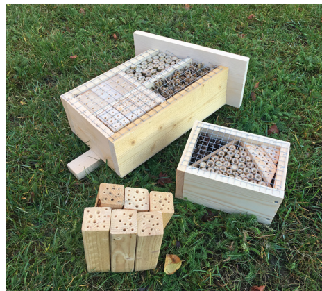
Här är några exempel på hur insekshotell kan se ut. Vad passar bäst hos dig? Sätt gärna upp flera varianter om du har plats.