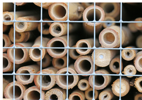
Olika bin vill ha olika storlekar på sina bon. Fyll därför på med strån med olika storlekar.