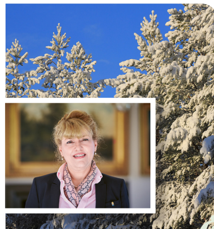
Minoo Akhtarzand LANDSHÖVDING

Önskar er och länet all lycka och välgång framöver men också en lugn och fridfull julledighet full av glädje tillsammans med nära och kära. Tack!