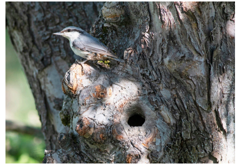
Den lilla nötväcken trivs i gamla träd.