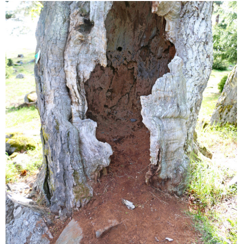
Gammal ihålig trädstam med mulm.