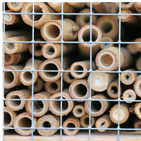
Olika bin vill ha olika storlekar på sina bon. Fyll därför på med strån med olika storlekar.

Länsstyrelsen Västmanland, november 2021