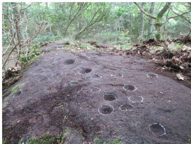
Eftra 26:1 Foto från sydost

1 skålgrop 5 cm i diameter och 0,5 cm djup.