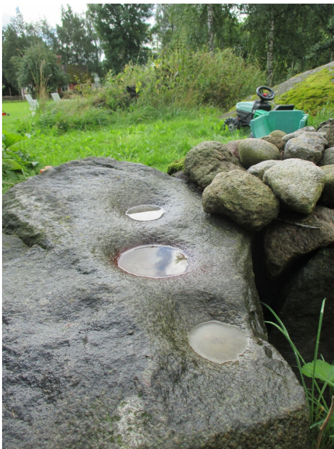
Nyfynd nr 18

Rapport över dokumentation av hällristningar 2017 av Sven-Gunnar Broström och Kenneth Ihrestam