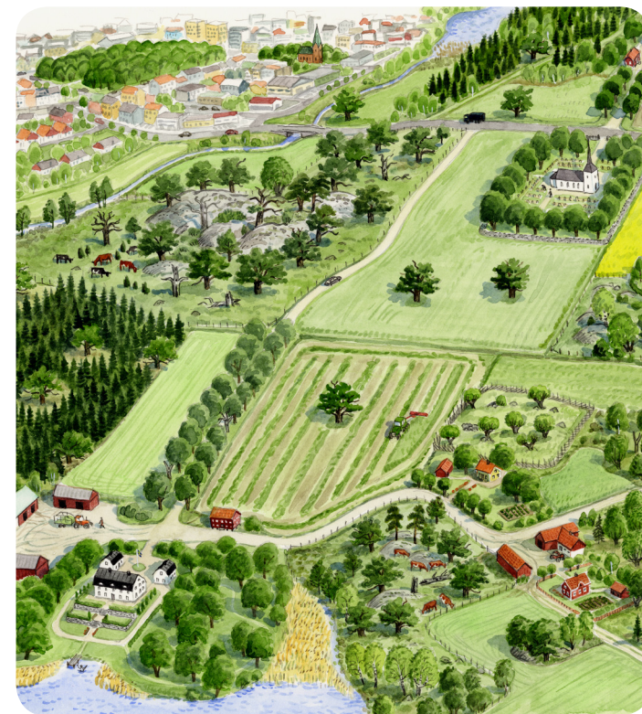
Illustration framsida: Nils Forshed. Övr. illustrationer Per Axell. Form: Ylva Englund

Har du frågor? Kontakta gärna Länsstyrelsen Halland, 301 86 Halmstad. Kontaktperson Lena Alness, Naturvårdsenheten, e-post: lena.alness@lansstyrelsen.se Telefon, växel: 035-13 20 00, fax nr: 035-10 75 48, e-post: halland@lansstyrelsen.se Internet: www.lansstyrelsen.se/halland