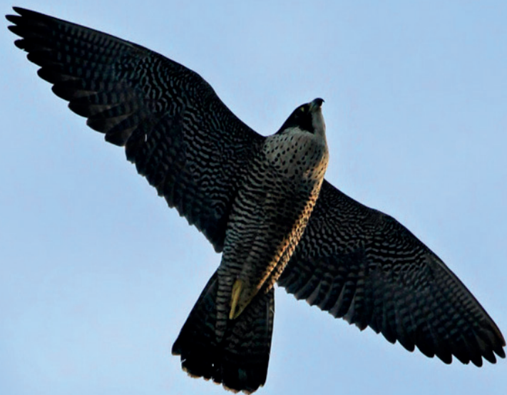
Pilgrimsfalken är en art vars boplatser utsätts för plundring.