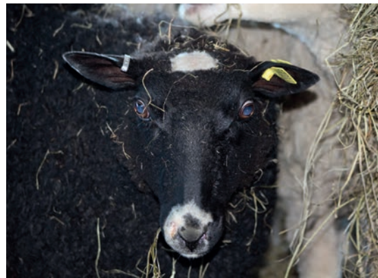
Får kan märkas med olika fabrikat av öronmärken, här ett bygelmärke i metall i ena örat och en plastbricka i det andra örat. Djuret har en godkänd märkning.

Den vanligaste typen är en plastbricka (som är en mindre variant av den som används till nötkreatur) eller en bygelbricka i aluminium eller plast. På plastbrickan finns landsbeteckning, produktionsplatsnummer och djurets individnummer tryckt på båda sidor av brickan. På bygelbrickan är landsbeteckning och produktionsplatsnummer tryckt på ena sidan och djurets individnummer på den andra sidan av brickan.