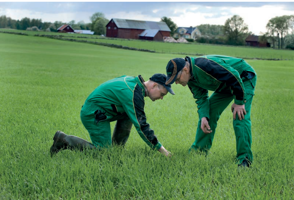
Det finns mycket att lära i Greppa Näringen.

Har du betesmarker som skulle behöva någon form av åtgärd finns det goda råd att få av Länsstyrelsens rådgivare. Det kan gälla allt från röjning och res-