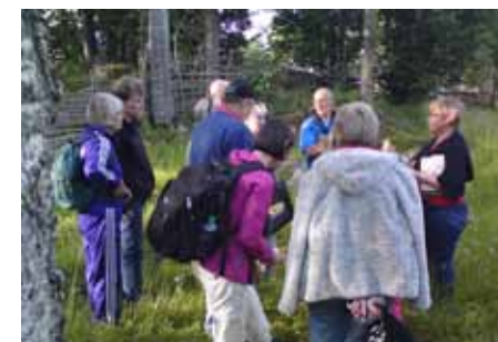
Blomstervandring i Börsebo, Hjärleved