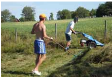
Gammal och ny teknik i Västra Fagerhult