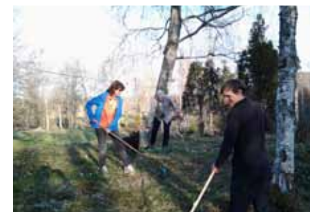
Fagning i Holmen, Habo

När svedjebruket upphörde och bonden blev bofast ökade behovet av gödsel och av ängsmark. "Äng är åkers moder", är ett gammalt ordspråk som talar om att arealen äng avgjorde hur många djur man kunde hålla liv i över vintern och i förlängningen hur mycket åker man kunde gödsla. När vi fick gödsel i påse tappade ängen sin ekonomiska betydelse, vinterfoder började odlas på åkermark och ängsbruket upphörde nästan helt. Den ängsareal som sköts idag är endast någon promille av den som fanns för cirka 100 år sedan.