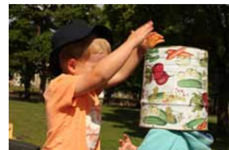
En stor konservburk från centralköket, de används både till att bygga med, men också att ha på huvudet. Hur låter min röst när jag pratar i en burk? Har du prövat att prata med en konservburk på huvudet? Rösten blir anorlunda och det väcker frågor hos barnen att arbeta vidare med!

servicen genom nya verksamheter och arbetstillfällen på landsbygden. Genom att stödja nyskapande idéer hos både enskilda personer samt nätverk, bestående av befintliga företagare, har projektet hittills stimulerat till 27 nya företag, 21 nya arbetstillfällen och flertalet nya produkter på landsbygden inom leaderområdet.