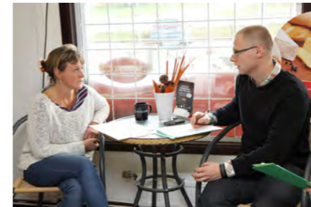
Energiinventeringen är i full gång