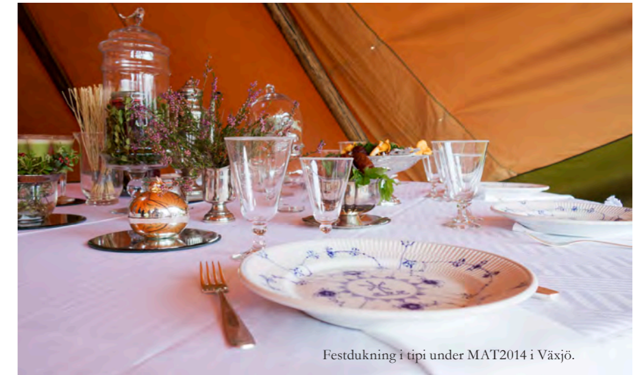
Festdukning i tipi under MAT2014 i Växjö.

- Nu gäller det att ta tillfället i akt att föra samman Småland som en matregion. Utnämningen manifesterar