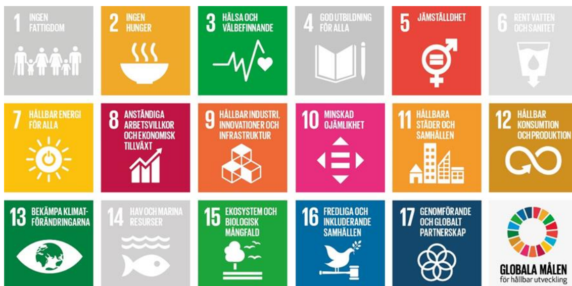
Figur 2 Illustration över de globala målen för hållbar utveckling som främst kopplar till åtgärdsprogrammet.