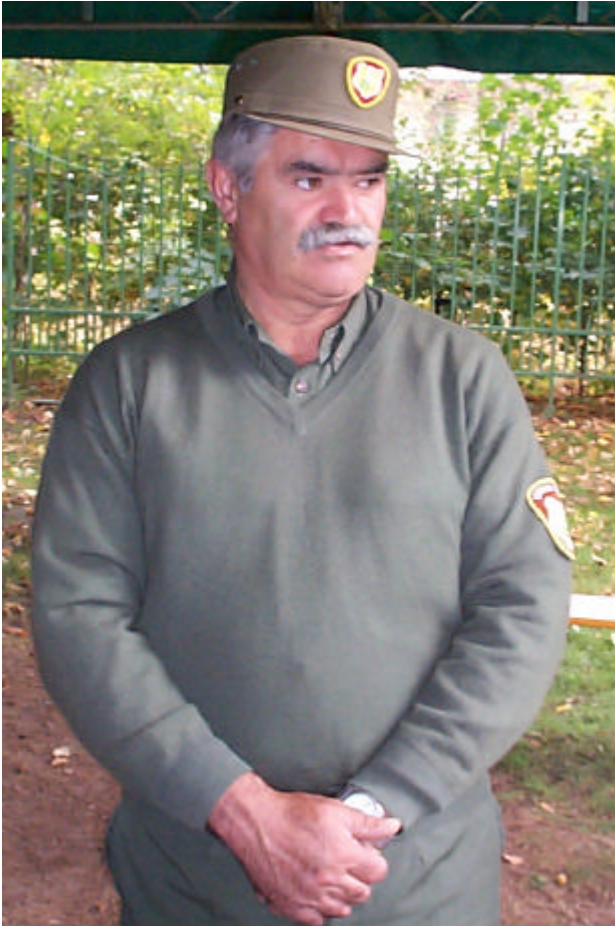
Ranger i Abruzzo

Parkförvaltningen visade hur man på ett effektivt sätt ”sytt ihop” alla finansieringsmöjligheter med Eu:s ramprogram mm. Även Agenda 21 insatser hade lagts till och man fick intrycket av att alla goda krafter samverkade.