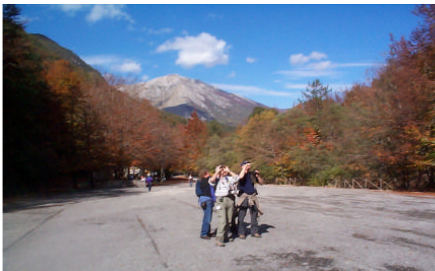
Abruzzo nationalpark– 160 km från Rom