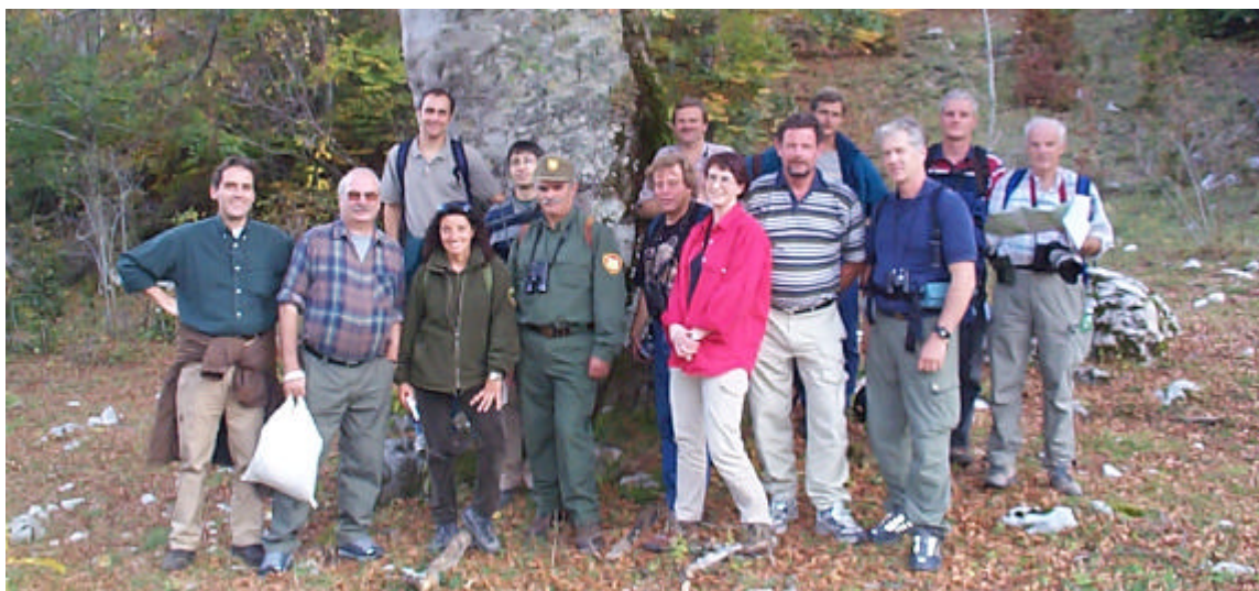
Några av resenärerna tillsammans med representant från Pan Parks och en parkvakt från Abruzzo

Parkens budget: 5 billion liras, som ger en lokal ekonomisk inverkan på ungefär 300 billion liras.