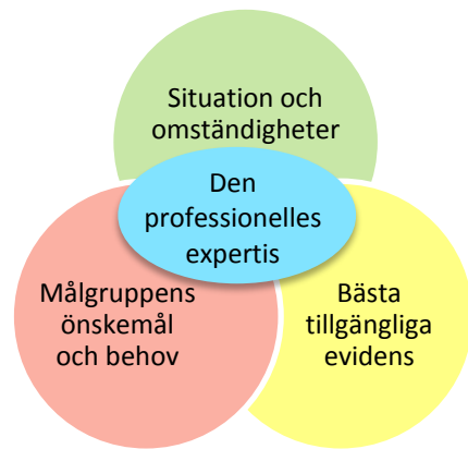
Figur 1. De fyra kunskapskällorna enligt en evidensbaserad praktik

En första kunskapskälla handlar om att få insikt om den situation och de omständigheter som den praktiska verksamheten råder under. En annan viktig kunskapskälla är bästa tillgängliga evidens inom området. Det är viktigt att komma ihåg att evidens handlar om det sammanvägda och bästa tillgängliga faktaunderlaget för en viss fråga. En tredje källa till kunskap är målgruppen. För att kunna utveckla föräldrastödet på ett sådant sätt att det attraherar föräldrar med olika bakgrund och livsvillkor måste vi ha kunskap om målgruppens önskemål och behov. Att alla föräldrar erbjuds samma möjlighet till stöd innebär inte med automatik att alla föräldrar har samma möjlighet att ta del av det stöd som erbjuds. Om stödet bara attraherar en viss grupp föräldrar finns en risk att ojämlikheten i hälsa ökar. I litteraturen kring implementering framhålls vikten av att kunna anpassa en insats både utifrån lokala förutsättningar och utifrån insatsens målgrupp. 9 Den fjärde och sista kunskapskällan handlar om hur den professionelle väger samman kunskapen från de övriga kunskapskällorna med sin yrkeskunskap och sin personliga kompetens.