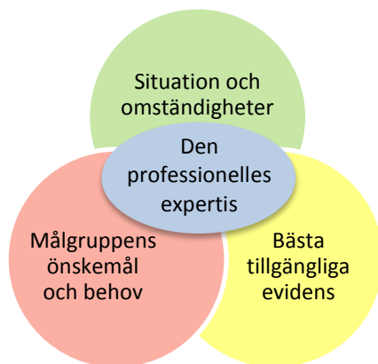
Figur 2. Kunskapsbaserad praktik

från olika typer av kunskapskällor (Figur 2.) (se exempelvis Jegerby U., 2008. Evidensbaserad praktik i socialt arbete ). Den första kunskapskällan handlar om att få insikt om den situation och de omständigheter som den praktiska verksamheten råder under. En annan viktig kunskapskälla är bästa tillgängliga evidens inom området. Det är viktigt att komma ihåg att evidens handlar om det sammanväga och bästa tillgängliga faktaunderlaget för en viss fråga. En tredje källa till kunskap är målgruppen. För att kunna utveckla föräldrastödet på ett sådant sätt att det attraherar föräldrar med olika bakgrund och livsvillkor måste vi ha kunskap om målgruppens önskemål och behov . Om stödet bara attraherar en viss grupp föräldrar finns en risk att ojämlikheten i hälsa ökar. Den fjärde och sista kunskapskällan handlar om den professionellas expertis . I länsstyrelsernas uppdrag kommer det också att handla om att integrera kunskaper och erfarenheter från de ideellt engagerade. Analysen kommer därför att innehåller frågor som ger kunskap om dessa fyra områden.