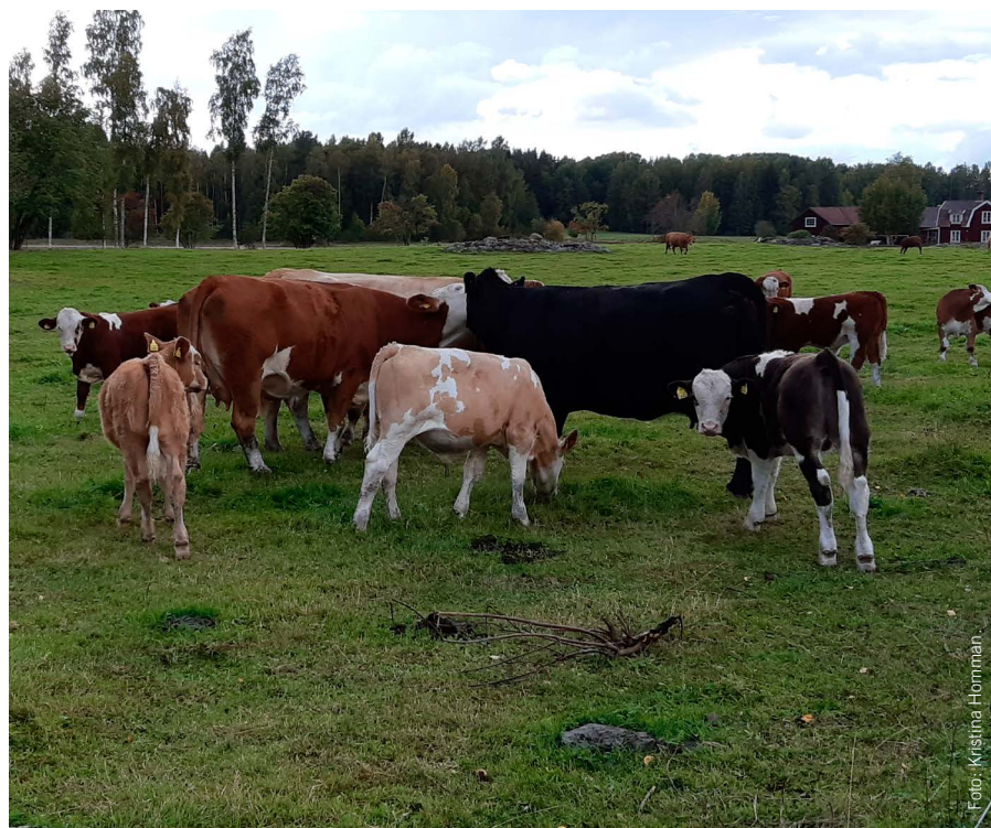
Köttjur av rasen Simmental.