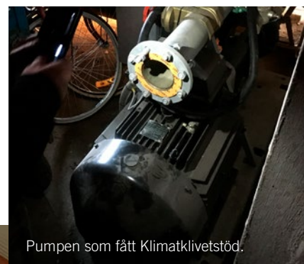
Pumpen som fått Klimatklivetstöd.

utsläppsberäkningen men med informationen på nätet gick det bra. De rekommenderar absolut andra lantbrukare att söka!