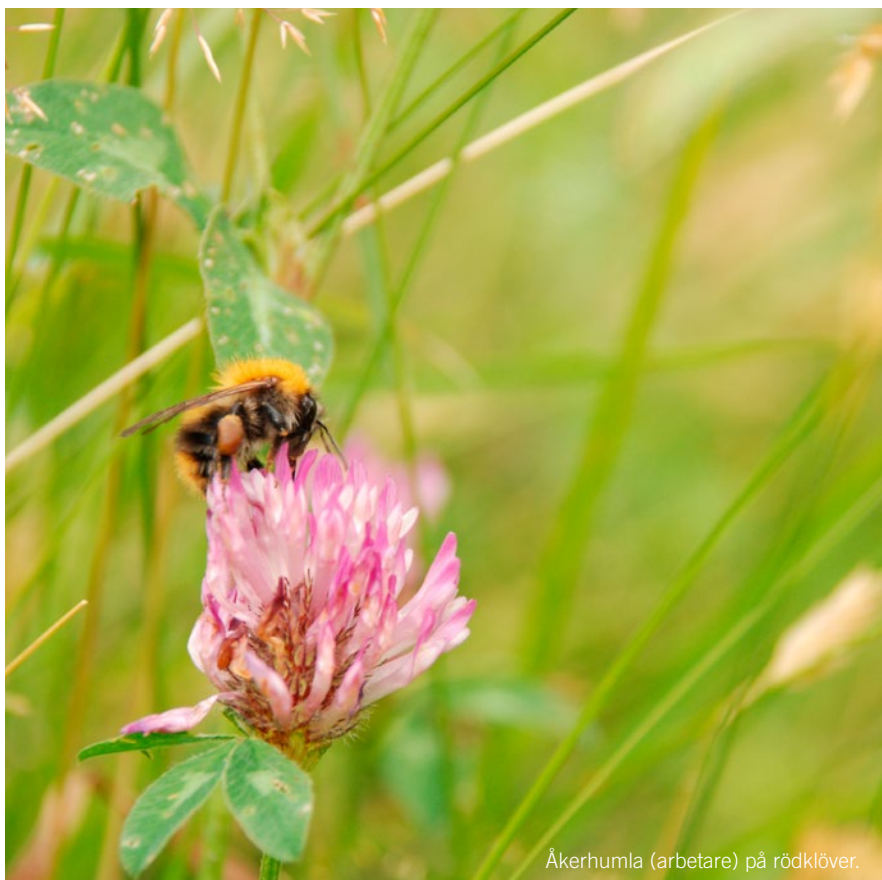
Åkerhumla (arbetare) på rödklöver.

I publikationen Gynna humlorna på gården lyfter Jordbruksverket fram att