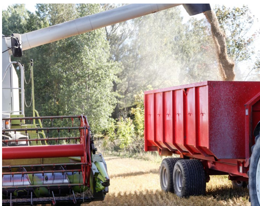
Skördetröska tömmer spannmål.