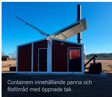
Containern innehållande panna och flisförråd med öppnade tak.