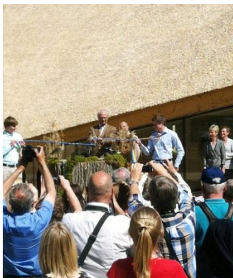
Kungen inviger naturum Tåkern