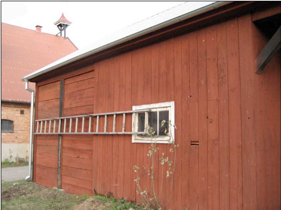
061107 Skiftesverksväggen i nordväst har byggts upp av det gamla båltrimret.