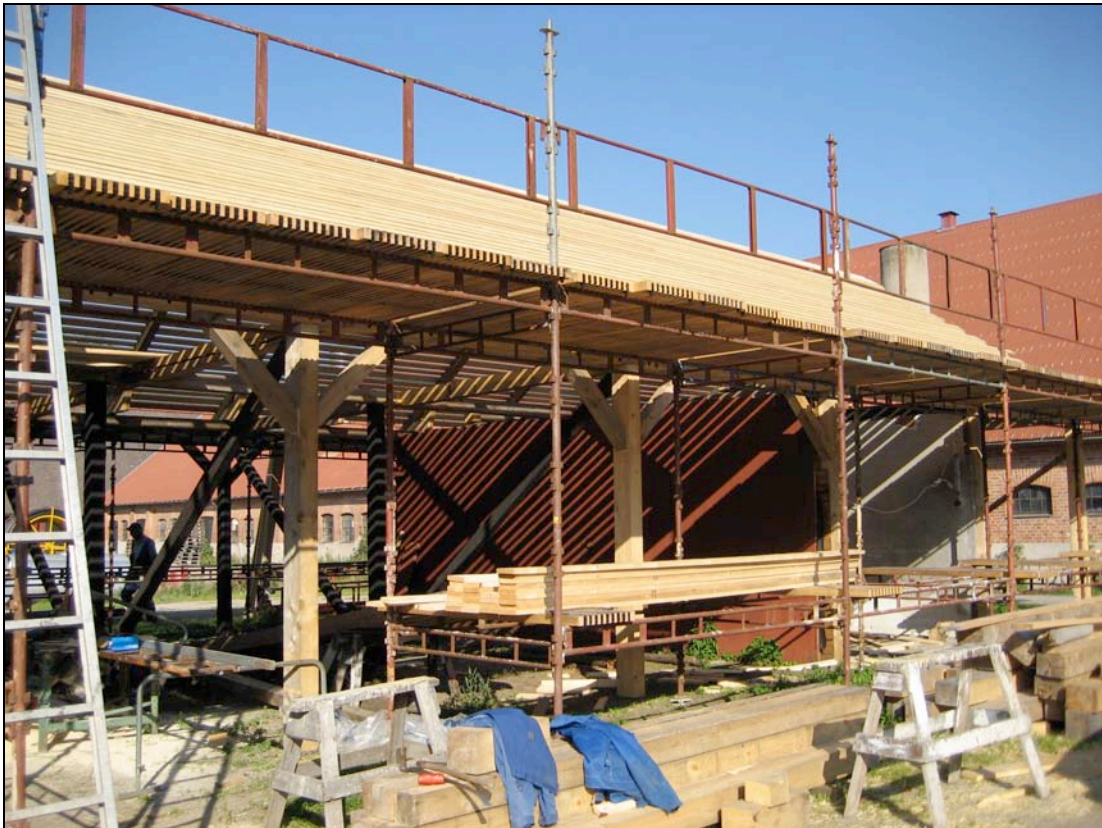
060913 Den norra delen av vagnslidret håller på att byggas upp.