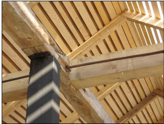
060927 Nytt svall läggs på hela taket