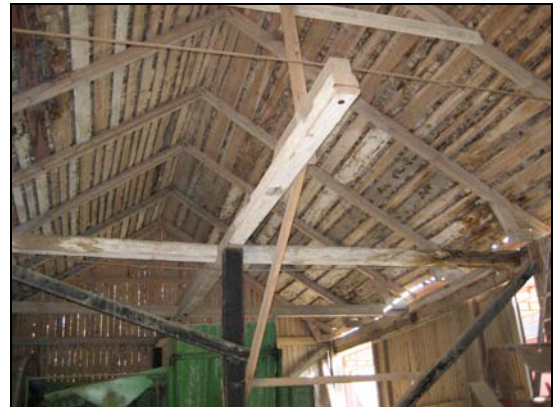
060913 Fuktskada på svallet på södra delen. Det beslutades att även denna del av taket skulle renoveras.