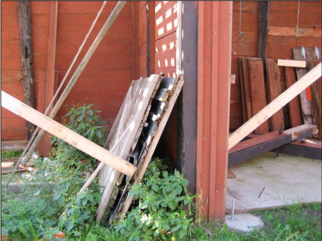
060913 Norra gaveln