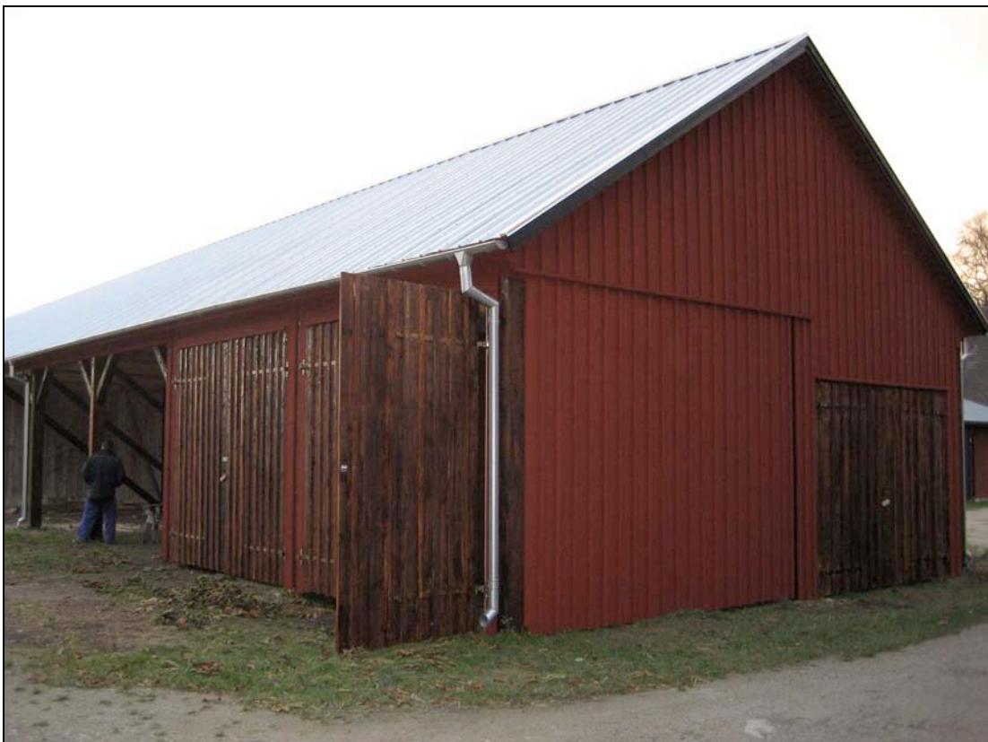
061107 Byggnaden är färdigrenoverad och har täckts med ett nytt galvaniserat pannplåttak. Det norra utrymmet har satts igen och fått en ny port mot öster.