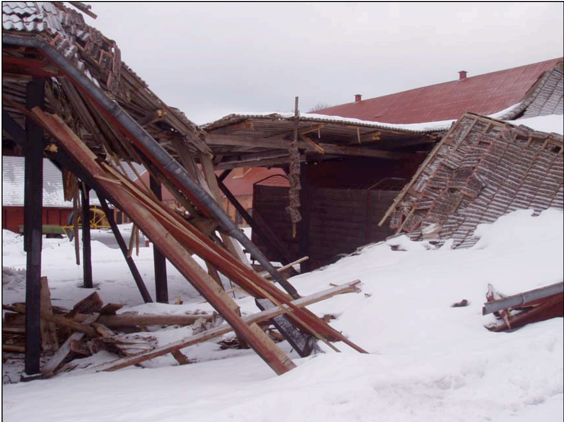
060215. Hela konstruktionen har rasat p.g.a. storm och snö.