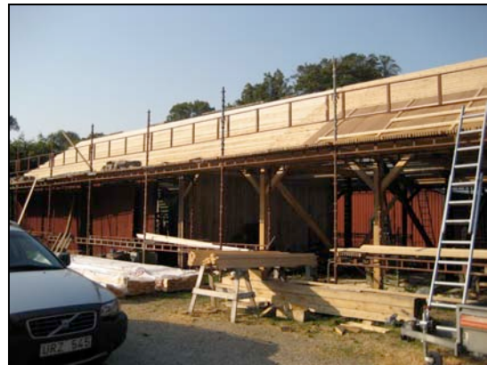
060927 Mellan svallet och pannplåten läggs masonit för att förhindra kondens