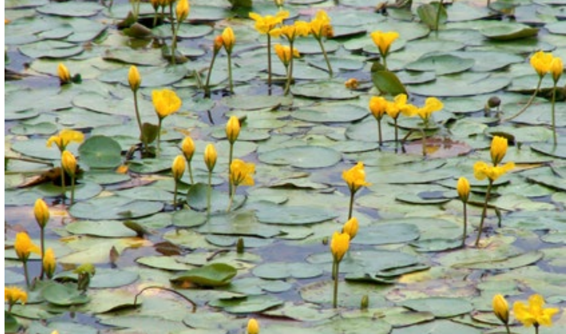
Sjögull ( Nymphoides peltata )