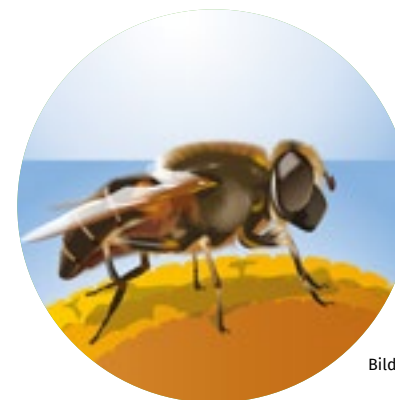
Bilder pollinatörer: Jakob Robertsson/Typoform och Naturvårdsverket