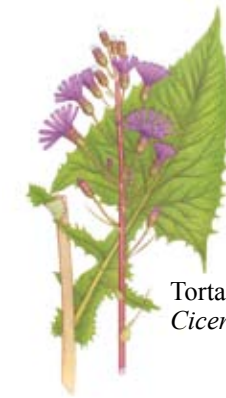
Torta Cicerbita alpina

The complete regulations are available on the County Administrative Board's website and on information boards in the area.