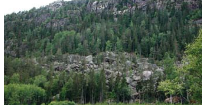
Från öster kan man överblicka den blockrika sluttningen som övergår i lodräta bergväggar. • From the east you can survey the boulder-covered slopes that turn into vertical rock faces.

Det har varit svårt att bedriva skogsbruk i den oländliga terrängen, och den gamla skogen har i stort sett lämnats orörd av yxa och såg. I branterna finns rikligt med gamla, grova träd och fallna, murkna trädstammar och uppe på platån är träden krumma och senvuxna.