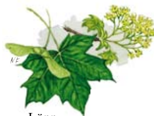
Lönn Acer platanoides

I naturreservatet finns en säregen blandning av olika skogstyper och kontrasterna är stora. Den senvuxna barrskogen på bergets platå liknar mest en fjällnära skog. Skogen i branterna, där det växer sydliga arter som lind och lönn, påminner om södra Sveriges blandskogar. Det finns också spår efter skogsbrand i så gott som hela området.