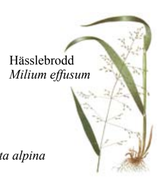
Hässlebrodd Milium effusum

Botaniska sevärigheter finns främst i den östra och södra sluttningen. Här växer till exempel nattviol, skogsnycklar, blåsippa, hässlebrodd och torta. • Sights of botanical interest are chiefly to be found on the eastern and southern slopes where species such as lesser butterfly orchid, common spotted orchid (ssp. fuchsii), liverleaf, wood millet and Alpine blue-sow thistle are growing.