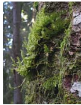
Aspfjädermossa Neckera pennata

På de gamla trädstammarna växer en rad sällsynta lavar, vedsvampar och mossor, till exempel olika gelélavar, violettgrå tagelav, korallblylav, stor aspticka, kristallticka och aspfjädermossa. I den gamla skogen finns också ett rikt fågelliv. Spillkråka, tretåig hackspett, gråspett och tjäder är exempel på fåglar man kan ha chans att stöta på.