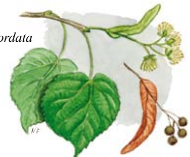
Lind Tilia cordata