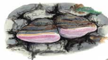
Rosenticka Fomitopsis rosea

Från Ånge: Kör väg 83 söderut. Cirka 8 km söder om Mellansjö svänger du av åt höger, mot Ensjölokarnas naturreservat. Följ sedan skyltningen.