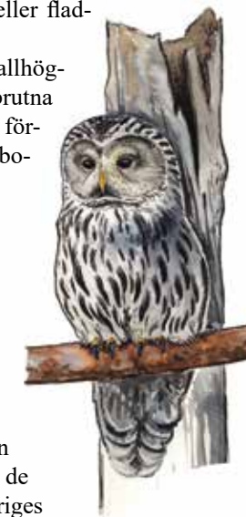
Slaguggla Strix uralensis

Mossor mikroskapania vedtrappmossa vedflikmossa timmerskapania Svampar doftticka grantickeporing koralltagsvamp kandelabersvamp Fåglar tjäder gråspett lavskrika järpe