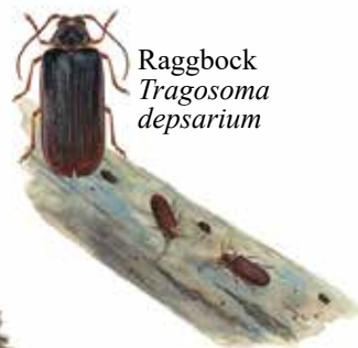
Raggbock Tragosoma deparium