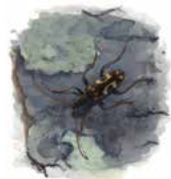
Mindre frågeteckenbock Evodinus borealis