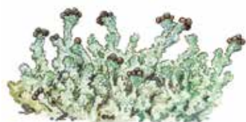
Dvärgbägarlav Cladonia parasitica

Branden gynnar lövträd och tall på bekostnad av gran. Inslaget av tall blir större eftersom tallen, med sin tjocka bark och högt upphissade krona, klarar en brand bättre än granen. Där branden öppnat upp har unga lövträd en chans att etablera sig.