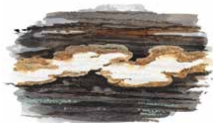
Fläckporing Antrodia albobrunnea

Fläckporing, dvärgbägarlav och raggbock är alla exempel på arter som är knutna till gamla tallskogar. Fläckporing, som är ovanlig i de flesta av länets gamla skogar, är något av en karaktärsart i Ensjölokarna. • The fungus Antrodia albobrunnea, the parasite cup lichen and the longhorn beetle Tragosoma deparium are all examples of species that are associated with old pine forest. Antrodia albobrunnea, which is rare in most of the country's old forests, is a particularly distinctive species for Ensjölokarna.