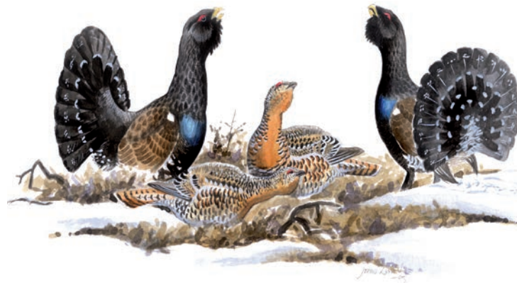
Tjädern trivs i de gamla barrskogarna på Järvsöklack. • The capercaillie thrives in the old coniferous forests on Järvsöklack.

Eftersom berget är både högt och brant ändrar naturen ofta skepnad. Mångfalden av naturtyper är en av anledningarna till att skogarna på berget blivit en fristad för många krävande växter och djur. Granskogen på norr- och östsidan är en stabil, skuggig och fuktig miljö och en perfekt plats för många idag ovanliga svampar, mossor och lavar. Här kan man hitta svampar som doftskinn, rosenticka och gränsticka. Den violettgrå tagellaven är en av flera olika hänslavar som draperar granskogens grenar. På lövträd, ofta gamla sälgar, lyser lunglaven