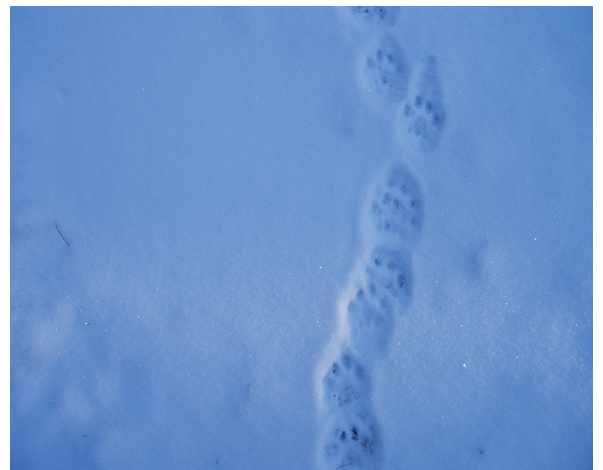
Spår efter två lodjur.

Brist på snö gjorde att områdesinventeringen av lodjur som Länsstyrelsen planerat tillsammans med jägarkåren fick ställas in. Istället håller Länsstyrelsen på att sammanställa de rapporter om lodjursföryngringar som vi fått kännedom om och som kunnat kvalitetssäkras fram till sista februari.