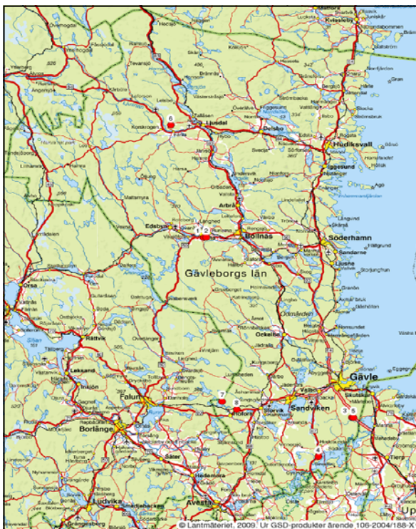
Skjutna lodjur i Gävleborgs län. Röd prick på kartan markerar var de 8 lodjuret fälldes.

Förra året fick vi en finsk/rysk varg till länet. Den så kallade Pessinkivargen invandrade till Sverige 06/07 och uppehöll sig en tid i Dalarna. Vintern 07/08 slog han sig ner tillsammans med en vargtik i Galven, Hälsingland. Dessa två utgör nu föräldraparet i Galvenreviret och en föryngring förväntas i år.