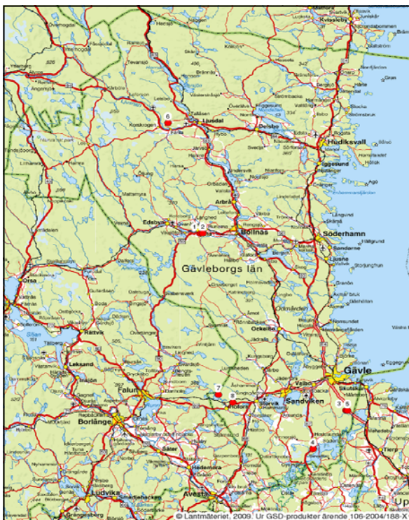
Skjutna lodjur i Gävleborgs län. Röd prick på kartan markerar var de 8 lodjurena fälldes.

Förra året fick vi en finsk/rysk varg till länet. Den så kallade Pessinkivargen invandrade till Sverige 06/07 och uppehöll sig en tid i Dalarna. Vintern 07/08 slog han sig ner tillsammans med en vargtik i Galven, Hälsingland. Dessa två utgör nu föräldraparet i Galvenreviret och en föryngring förväntas i år.