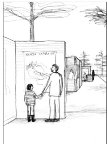
Idéskiss av landgång vid huvudentrén. White Arkitekter.