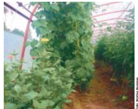
Kallhusodling av tomater, gurka och bönor hos Hultåsa Gård, Sundborn.