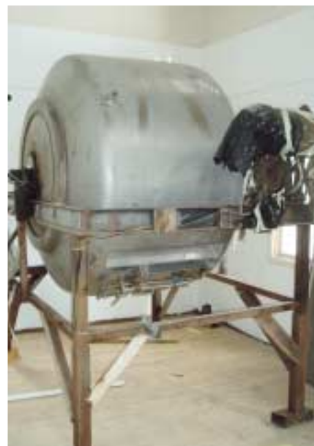
I blandaren på bilden bearbetas den våta halmen och svamp mycelet till substrat.

Ostronskivling odlas i ren värmebehandlad vetehalm utan syntetiska tillsatser eller bekämpningsmedel. Till den värmebehandlade våta halmen tillsätts mycel för önskad sort av ostronskivling och fylls i plastsäck med hål i. Mycel växer in i halmen och efter ca 3–4 veckor kan första skörden tas. Svampen växer ut i klasar genom hålen i plastsäcken, där svamphattarna delvis