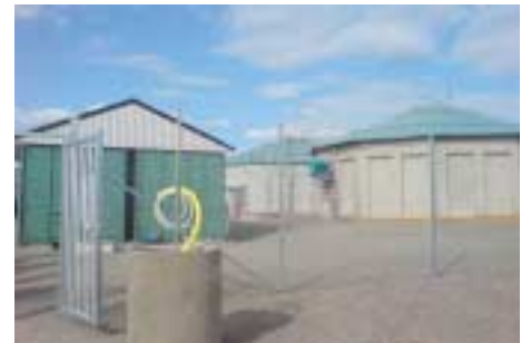
Exempel på gårdsanläggning vid Sötåsen Naturbruksskola för rötning av gödsel.

I Sverige är det oftast fordonsgas som är målet med anläggningen. Dels för att det i de flesta fall ger bäst ekonomisk lönsamhet, dels för att biogas som ersätter bensin och andra fossila bränslen i våra fordon ger en väldigt stor miljövinst!