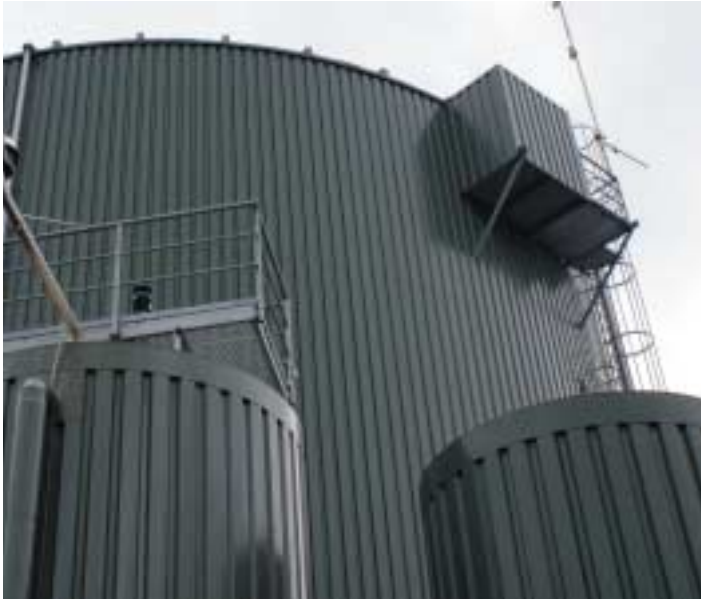
Samrötningsanläggning med bl.a. slakterirester och gödsel, Wrams Gunnarstorp.

avfall och omvandla det till energirik gas, biogas. Bolaget Vansbro Biogas AB är i läge att söka pengar för en stor samrötningsanläggning i Vansbro. Kostnaden beräknas till 48 Mkr för förbehandling, rötning och uppgradering av gasen till fordonsgas.