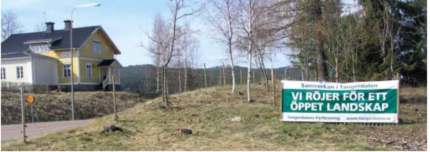
En banderoll som informerar om verksamheten är placerad så att den är väl synlig från landsvägen.

åker. Problemet med får på gatorna har man vänt till en happening, det årligt återkommande "Corre de fåros", då alla som vill får följa med när fåren vallas genom byn hem till sina fårhus efter sommarens beten. Det äger även rum en mängd kringaktiviteter som måltider, föreläsningar och prova på tovnig. I år kommer aktiviteterna att kombineras med SM i fårklippning, som äger rum i Undersåker 17 oktober.