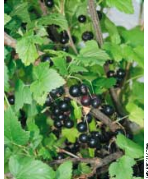
Svarta vinbär hos Tillmans bärödling, Grangärde.

Utöver kurser, fältvandringar, studiebesök finns det också möjlighet till enskild rådgivning angående yrkesmässig odling av grönsaker o bär genom projektet.