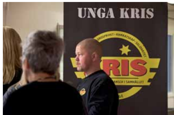
Många frivilligorganisationer hade montrar i foajén.

– Sekretessen är en integritetsgräns som vi måste respektera. Om man riskerar att lämnas ut till höger och vänster vill man kanske inte ha något samarbete alls. Men om man är fullt tydlig med vad samverkan gäller och var gränserna går, då är det sällan några problem.