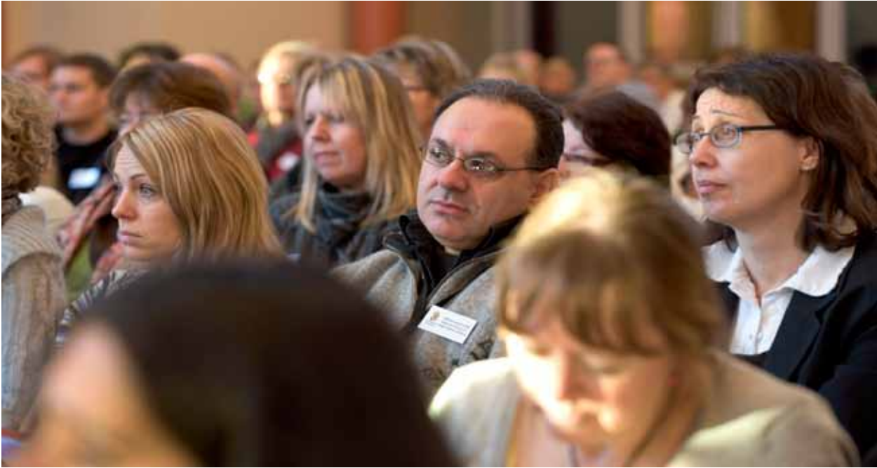
I publiken satt människor som arbetar med barn i hela Gävleborgs län.

specialpedagoger och skolkuratorer liksom med socialtjänsten.