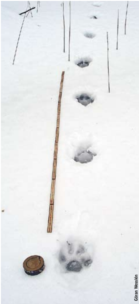
Lodjursspår i Färnebofjärden