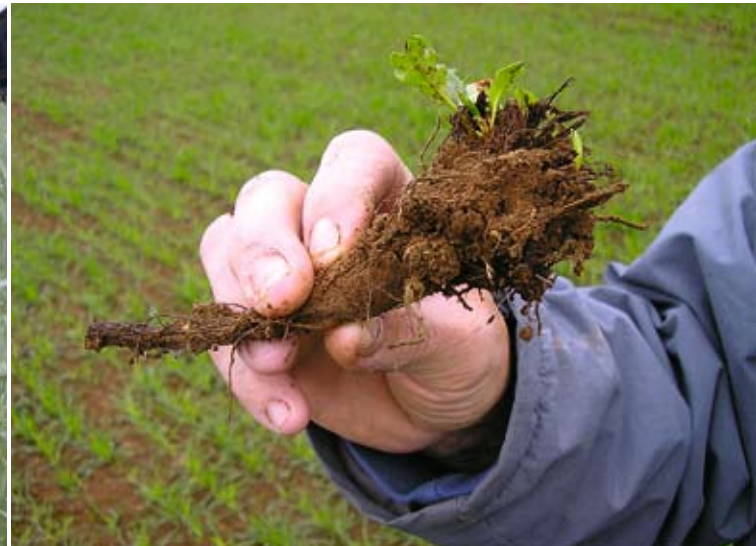
En avhuggen skräpparot kan skjuta nya skott.