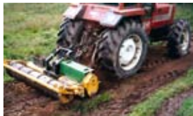
Fräsa bort stubbar i betesmarker – typisk MR-tjänst