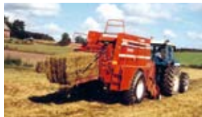
Pressning av hö, halm och ensilage – typisk MR-tjänst