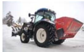
Snöröjning – typisk MR-tjänst