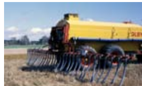
Rampspridning av flytgödsel – typisk MR-tjänst