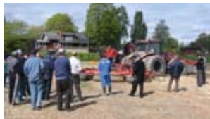
I maskinringen utbyter man inte bara maskintjänster utan också erfarenheter, här om jordbearbetning i Folkärna.