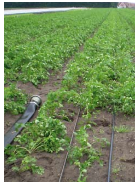
Försök med droppbevattning i persiljerot.

Nyskördade och tvättade morötter i en mix av färger från årstidernas odlingar i Billeslund.