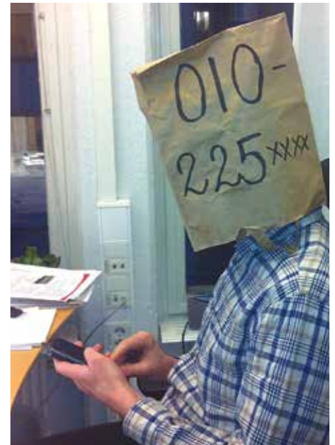
Börjar numret på 010-225? Då är det Länsstyrelsen som ringer.

Det är lätt att få snabbare service från oss om ni kommer ihåg början på våra telefonnummer. Länsstyrelsen i Dalarna börjar med 010–22 50 och sedan tre ytterligare siffror. I Gävleborg börjar telefonnumren med 010–22 51.