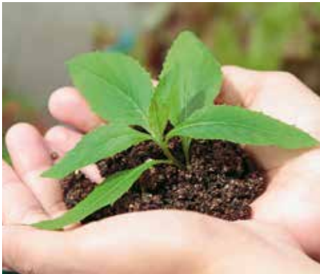
Finna lösningen.

Vad ser du för utmaningar? Tillsammans kan vi finna lösningen som kan bli en innovation. Utveckla din idé tillsammans med forskare och rådgivare och få betalt för din arbetstid – ett unikt tillfälle att göra verklighet av den där idén som du har gått och klurat på.