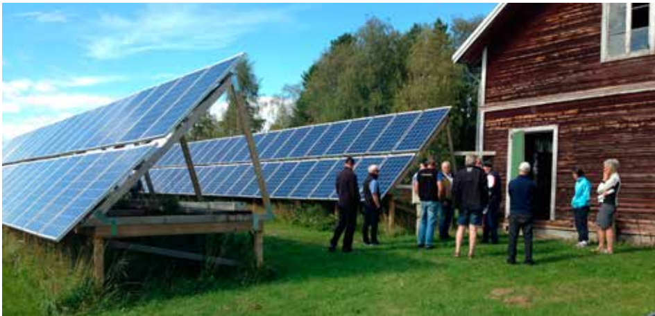
Besökare för samtal om markbaserad solcellsanläggning i Bleka.

Efter tre år är Energilots 2.0, som drivits av LRF i Dalarna och Gävleborg, nu avslutat. Projektet pågick mellan augusti 2011 och december 2014 och finansierades av EU:s landsbygdsprogram och LRF. Syftet var att stötta landsbygdsföretagare i affärer på förnybar energi och energieffektivisering. På längre sikt ville vi främja en bättre ekonomi i de gröna näringarna och samtidigt göra miljö och samhälle en tjänst. Hur har det då gått?