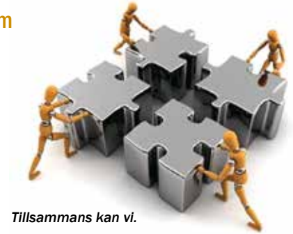
Tillsammans kan vi.