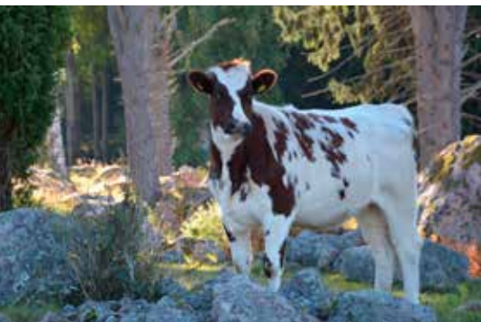
Om du har mjölkproduktion på din gård är du en primärproducent.

Primärproduktion är första ledet i livsmedelskedjan. I år har länsstyrelserna ett särskilt uppdrag att registrera alla primärproducenter. Är du primärproducent ska du anmäla din verksamhet till Länsstyrelsen. Länsstyrelsen registrerar din verksamhet och bestämmer vilken riskklass din livsmedelsproduktion tillhör. Registret används sedan för tillsyn och kontroll. Hur vet du då om du är en primärproducent?