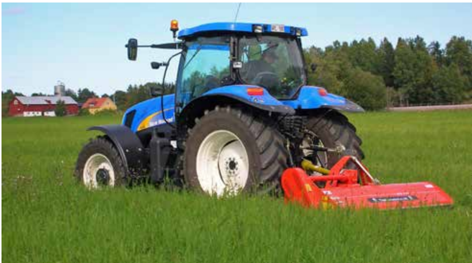
Skötselkraven på jordbruksmark har blivit hårdare. Du måste från och med i år årligen utföra någon slags aktivitet på dina marker.

Den 16 mars drar årets SAM-ansökningsperiod igång när SAM-Internet öppnar för året. Sista ansökningsdag är den 12 maj. SAM-Internet kommer att innehålla förändringar eftersom det finns nya jordbrukarstöd att söka, men utseendet och utförandet är i stora drag samma. Du loggar enklast in i programmet med e-legitimation, men det fungerar även med lösenord. Om du använder lösenord så kom ihåg att beställa det från Jordbruksverket i god tid innan det ska användas. I år behöver du inte skicka in någon underskriftssida om du loggat in med lösenord. Det räcker att du skickar in ansökan elektroniskt genom att klicka på knappen "Skicka in". Om du behöver hjälp med ansökan så svarar Länsstyrelserna i Dalarnas och Gävleborgs län samt Jordbruksverket gärna på dina frågor. Det finns även möjlighet att boka en dator på länsstyrelserna för att göra SAM-ansökan där. Du når oss på 0771-67 00 00. För att komma till just din länsstyrelse knappar du in ditt personnummer.