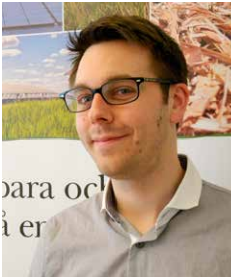
Christian Blanck, projektledare LRF Energilots 2.0

Text och foto: Christian Blanck 026-245973 christian.blanck@lrf.se