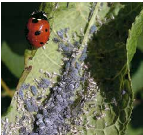
Nyckelpiga och bladlöss.

Nu ska alla yrkesmässiga odlare inom hela EU tillämpa Integrerat växtskydd. Målet är att användningen av växtskyddsmedel ska minskas och bekämpning ska ske med effektiva och hållbara metoder.