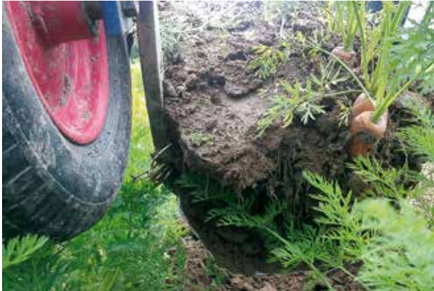
Visning av morotsupptagare.

Dalarna och Gävleborg har från 2012 till sommaren 2015 gemensamt drivit "Trädgårdsprojektet Mera Grönt". Syftet med projektet har varit att genom kompetensutveckling stötta såväl nya som etablerad odlare av grönsaker och bär i våra län. Att stötta den befintliga odlingen och jobba för att utöka odlingen i vår region ger möjlighet till företagande på landsbygden och bidrar till att miljömålet "Ett rikt odlingslandskap" kan uppnås.