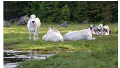
Rikt odlingslandskap Stutar på bete på havsstrandsäng.

Gemensamt för kompetensutveckling och rådgivning inom "Greppa näringen", "Ekologisk produktion" och "Ett rikt odlingslandskap" är att mängden pengar för insatserna är betydligt mindre i den här programperioden än i den föregående. Det gör att antal aktiviteter som genomförs kommer att vara färre än i föregående period. Länsstyrelsen har ansvaret för att kompetensutveckling och rådgivningsverksamhet bedrivs men en del av aktiviteterna kommer att upphandlas eller utlysas så att rådgivningsorganisationer