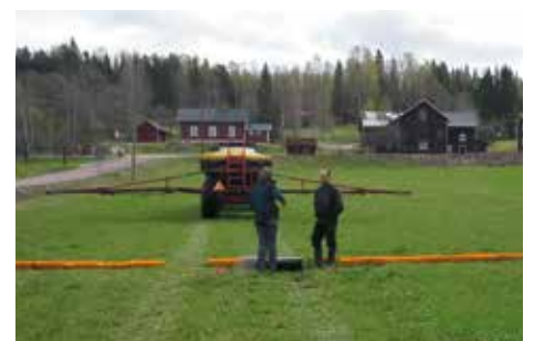
Hydrotest. Test av mineralgödselspridare kan ingå i Grepparådgivning.