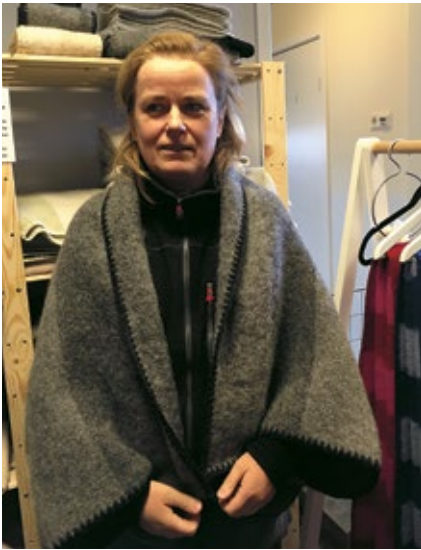
För dem som inte behöver en hel pläd finns axelfiltens som värmer.

Det produceras en del ull i vårt län som inte tas till vara. Förhoppningar om att det ska ändras finns hos fler än mig. Polyester och bomull är inte bra för miljön och på detta går det inte att producera på ett varsammare sätt här hos oss.