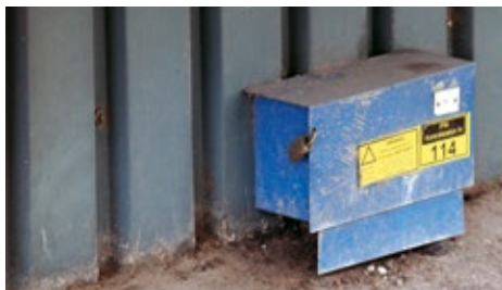
Bekämpar du skadedjur i dina byggnader? Tänk på att du ska spara dokumentation av bekämpningen.