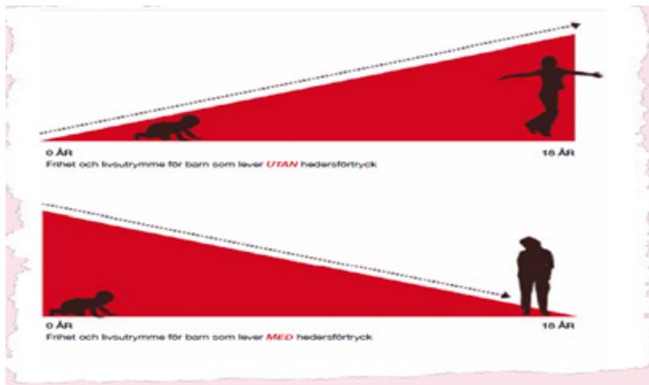
Figur från Länsstyrelsen Östergötlands rapport "Det handlar om kärlek" (2013)