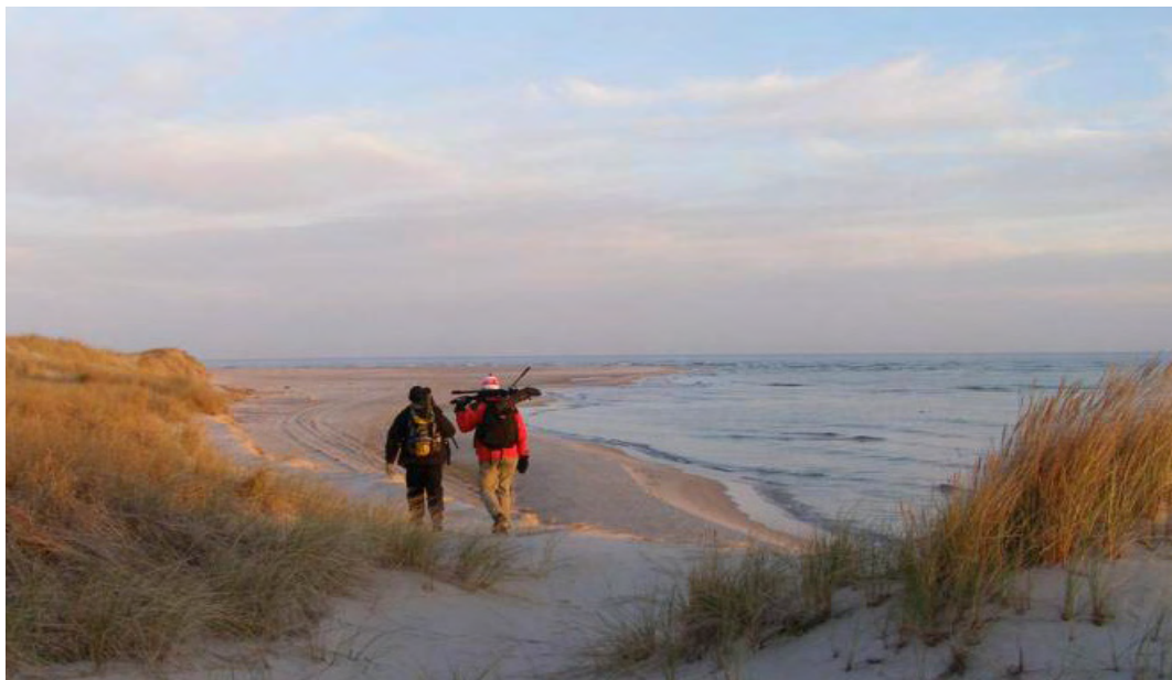
Gotska Sandön.

om bidrag till vård och underhåll av byggnadsminnen samt övrig kulturhistorisk bebyggelse, arkeologiska undersökningar, informationsinsatser och särskilda projekt.