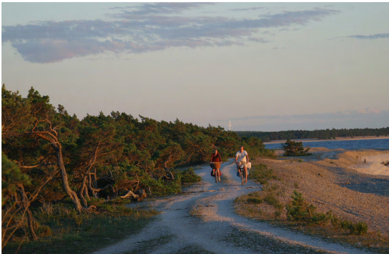
Gotländsk kust.

För många mindre entreprenörer inom natur- och kulturturismen ter det sig svårt att få ekonomi på verksamheten som bedrivs, kunskaper om prissättning och produktens/nyttjandets betydelse för en hållbar utveckling är låg. Samverkan mellan de dominerande researrangörerna, förvaltare (t ex Länsstyrelsen), och de små entreprenörerna med goda produkter är svag eller i det närmaste obefintlig. Åtgärder för att förbättra detta krävs. I dag kan t.ex. insatser med guidning bara ge kompletterande eller biinkomster för dem som har huvudparten av sin försörjning på annat sätt. Intäkter från den kommersiella verksamheten skall i ökad grad gå till skötseln av de natur- och kulturmiljöer som nyttjas.