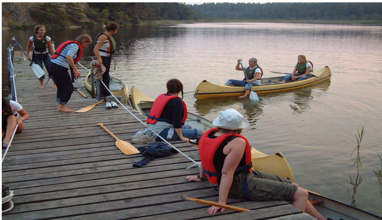
Kanotfärd Lojsta träsk.