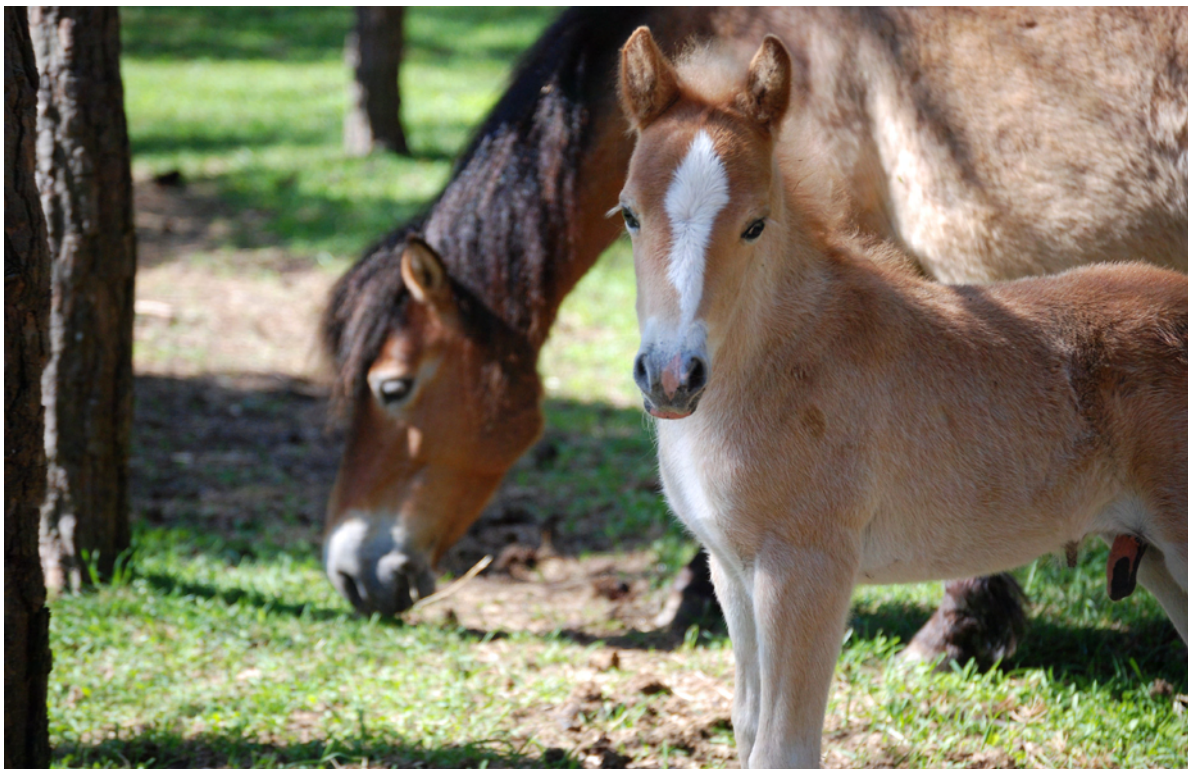
Russ på Lojsta haid.

Vissa tydliga tendenser lyfts fram. Konsumenternas makt ökar. Lågprisflyg och internet spelar en allt större roll. Det globala resemönstret har därmed delvis förändrats. Fler destinationer har blivit tillgängliga för bredare målgrupper. Andelen äldre och mer köpstarka konsumenter blir allt större. Konsumenterna blir också alltmer kunniga och miljömedvetna. Platsen och aktiviteterna blir allt viktigare i förhållande till själva resan. Efter valet av resmål och aktivitet väljer man transport efter pris. Även tidsjakten ökar, man vill hinna mer på kortare tid. Gränser mellan näringar suddas ut. Det går inte längre att utveckla turism utan att ta utvecklingen av lokalsamhället i beaktande.