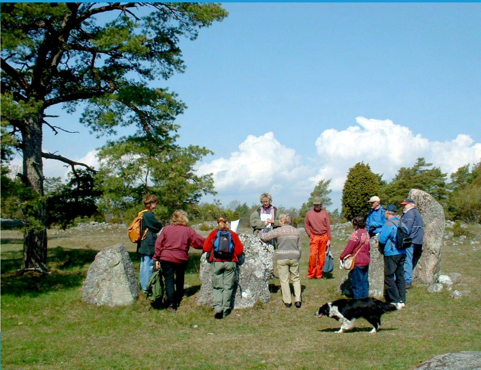
Förehistoriskt gravfält, Gålrum i Alskog.

Turistisk omvärldsanalys för Gotland, Turismens Utredningsinstitut