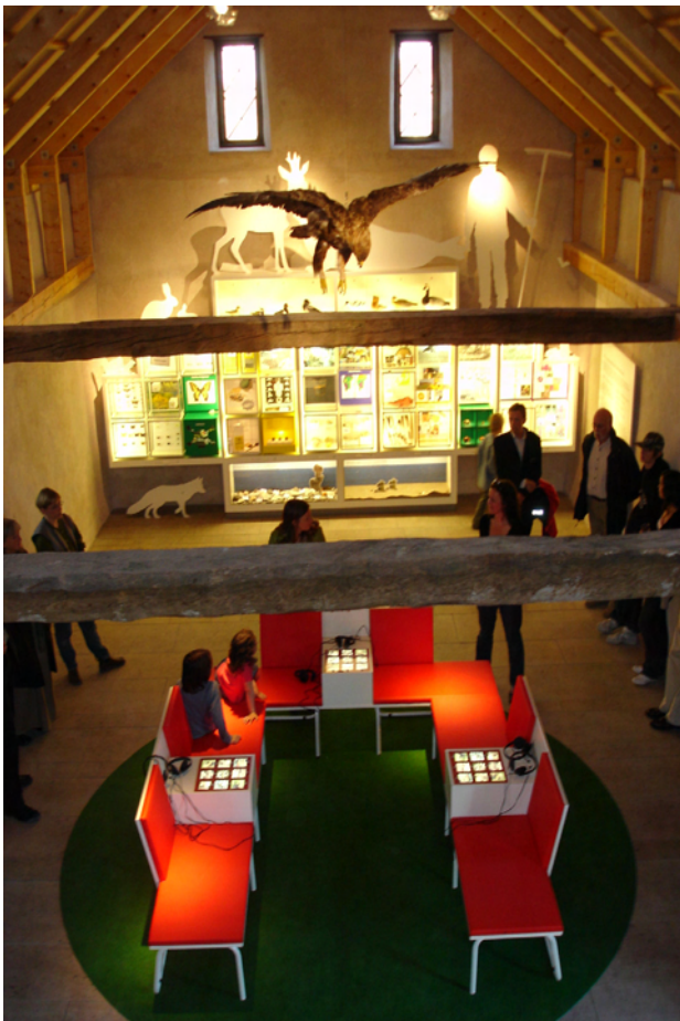
Naturum, Vamlingbo.