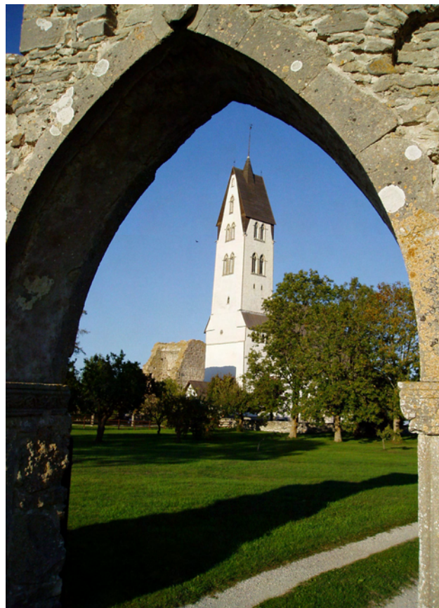
Gothems kyrka.

Service och infrastruktur som transport och boende är visserligen förutsättningar och medel för att besökare ska kunna ta del av destinationens utbud men de verkliga ”dragarna” och där mycket av attraktionskraften ligger, där det unika finns, är just i naturen och kulturen. Detta har konstaterats i såväl akademiska kretsar som i rese- och besöksnäringen. Attraktioner baserade