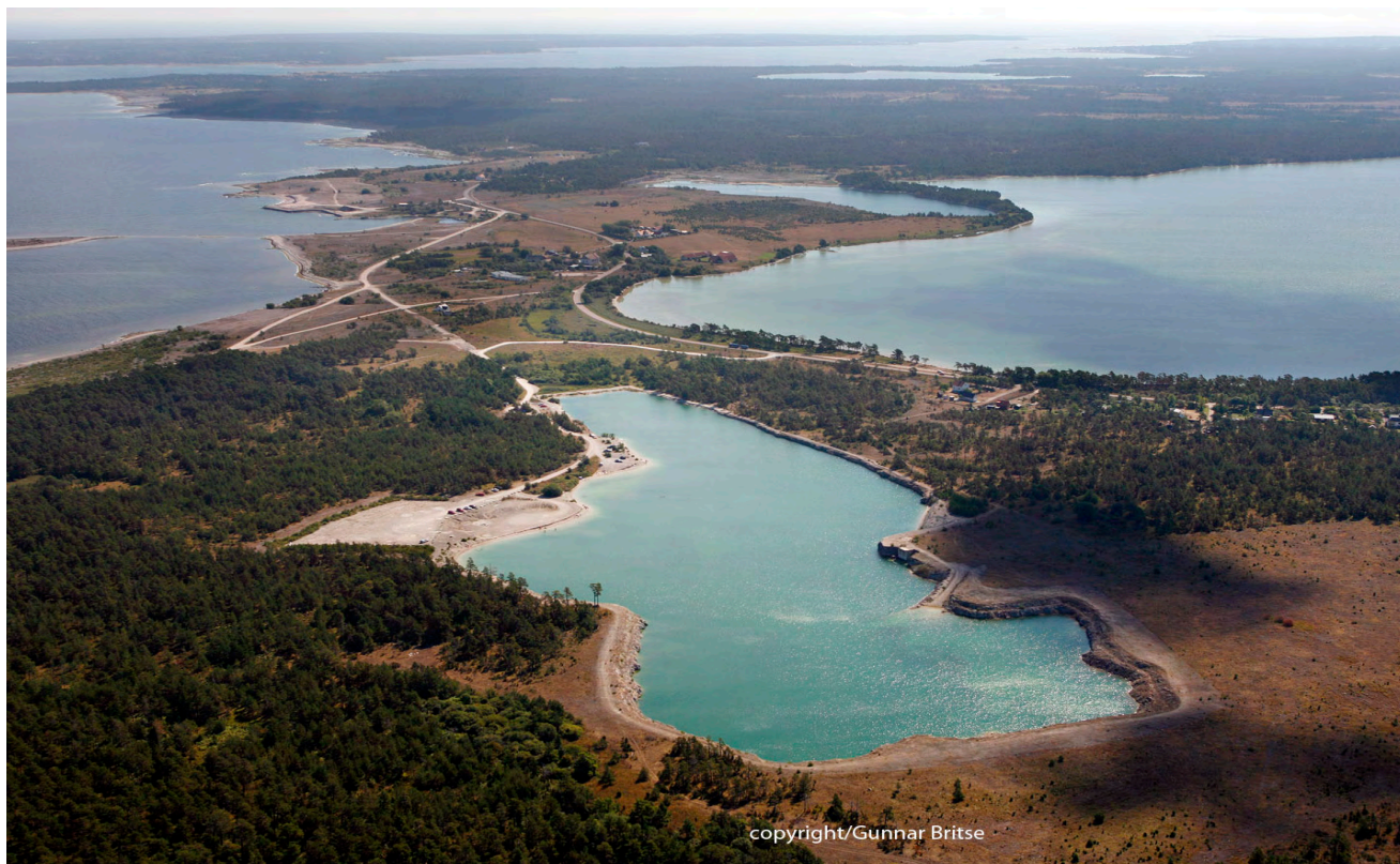
Blå lagunen, Ar och Bästeträsk i Fleringe.

”Länsstyrelserna i Gotlands, Västra Götalands, Värmlands, Jämtlands och Norrbottens län skall ta fram länsvisa program för hur natur- och kulturturism, som ett led i arbetet med regional utveckling, kan utvecklas i länet. Respektive länsstyrelse skall utreda möjligheterna till att naturvård och arbetet med kulturarvet och utveckling av natur- och kulturturism ömsesidigt kan stödja varandra. Med detta som bas skall varje länsstyrelse ta fram länsvisa program för hur natur- och kulturturismen kan utvecklas i länet. Avsikten med de länsvisa programmen är bl.a. att visa hur skyddade områden och andra natur- och kulturvärden kan och bör nyttjas för hållbar natur- och kulturturism. Länsstyrelsen skall i arbetet särskilt utgå från vad regeringen anför i skrivelsen En samlad naturvårdspolitik (skr. 2001/02:173), propositionen En politik för en långsiktig konkurrenskraftig svensk turistnäring (prop. 2004/05:56) samt propositionen Svenska miljömål – ett gemensamt uppdrag (prop. 2004/05:150). Länsstyrelsen skall vidare beakta prioriteringarna i det regionala tillväxtprogrammet. I län med regionalt självstyrelseorgan eller kommunalt samverkansorgan skall programmet tas fram i nära samverkan med dessa.