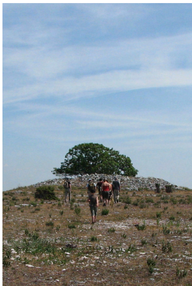
Linnés ask, Stora Karlsö.

TUI:s utredning är genomförd utifrån ett allmänt perspektiv, medan detta uppdrag begränsas till det som rör skyddade områden, offentligt ägda eller privatägda med fastställda skyddsföreskrifter. Programmet för natur- och kulturturism har därför avsiktligt begränsats till detta. Frågan om natur- och kulturguider har inte närmare analyserats, då detta ingår i programmet som helhet. Däremot kan TUI:s analys utgöra en god grund även för det pågående arbetet med varumärket Gotland, vars syfte är att skapa en varumärkesplattform som är gemensam för ön.