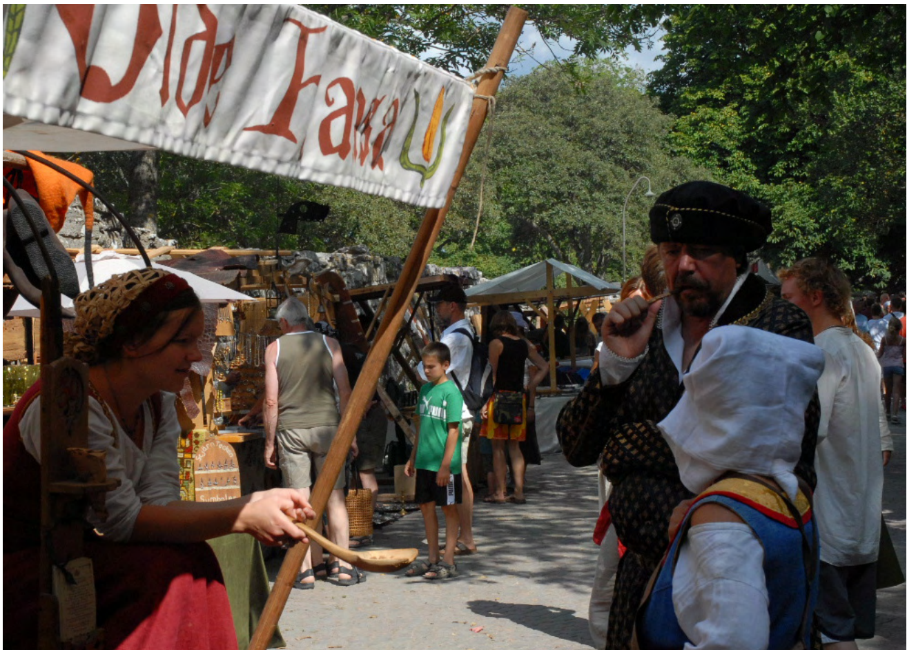
Medeltidsveckan 2007.