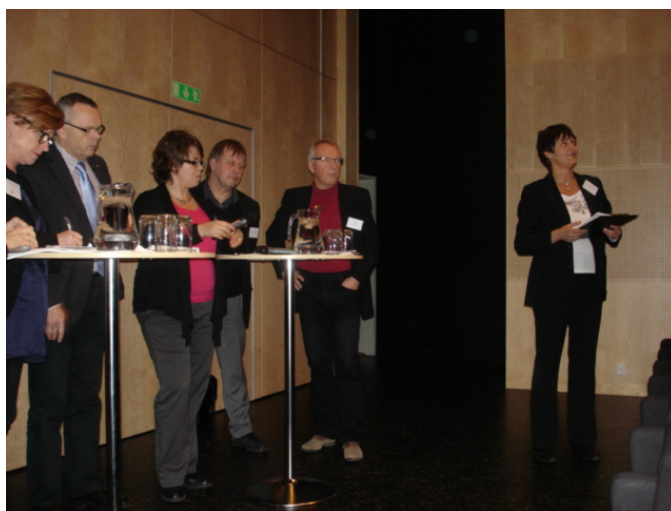
Paneldeltagarna fick frågor från publiken

Finns det ett politiskt tryck kring jämställdhet och ett förändrat företagarett i grunden? Alltså en debatt om att reglerna är förlegade och om hur vi ser på mäns och kvinnors företagande. Att jämställdhet inte bara är en administrativ fråga (fråga från publiken).