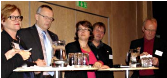
Paneldebatten avslutades med några "ord på vägen" till konferensdeltagarna