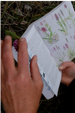
I vår kommer kotöisar att ses för att se på floran i betesmarker.

Måste man gräva i ett vattenförande vattendrag/dike så krävs normalt ett tillstånd för vattenverksamhet enligt 11 kap. miljöbalken. Ansökan om tillstånd för vattenverksamhet finns på Länsstyrelsens hemsida.