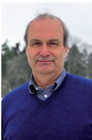
Kjell Norman

De första månaderna under 2013, har liksom avslutningen av 2012, präglats av en debatt kring en viktig fråga för det gotländska lantbruket och landsbygden, nämligen den framtida färjetrafiken. LRF har i en utredning visat på att en bra färjetrafik både för gods och persontrafik är avgörande för möjligheterna att utveckla verksamheter inom primärjordbruket, men framförallt för förädlingsindustrin. Enligt undersökningen så skulle konkurrensneutrala fraktkostnader möjliggöra cirka 1100 nya arbetstill-