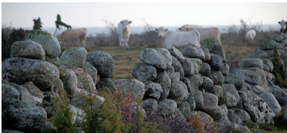
Det är nu sista chansen för den här gången att söka stöd för restaurering av stenmurar.

När det gäller överloppsbyggnader kommer vi inte att bevilja mer stöd för närvarande.