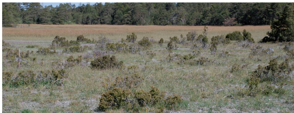
Detta är en typisk alvarmar.

Utmärkande för alvarbete (grödkod 56) är att jordlagret är tunt och magert, växtligheten är tunn och låg. Oftast växer gräset i tussar och inte som en