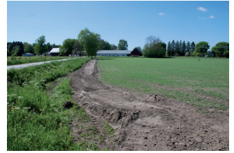
De färskta spåren efter fibergrävningarna syns över hela ön.

I anmälan om samråd ska en tydlig karta över ledningsdragningen samt en kortare beskrivning av arbetet (grävningdjup, plöjning, schaktning, etc) skickas in till Länsstyrelsens natur- och friluftslivsenhet. Länsstyrelsen kontaktar därefter Gotlands museum som gör kontroll av kulturvärden. När anmälan kommit in påbörjas samrådet. Handläggningstiden är minst 6 veckor. För att påskynda handläggningen är det en god idé att kolla upp vilka natur- och kulturvärden som finns i det aktuella området i förväg. På Skogsstyrelsens webb http://minasidor.skogsstyrelsen.se/skogensparlor/ finns de allra flesta områden markerade som kan innebära konflikt med en fibernedläggning. Undviks dessa områden så har man gjort en god planering och ledningen kommer sannolikt att kunna genomföras enligt ritning.