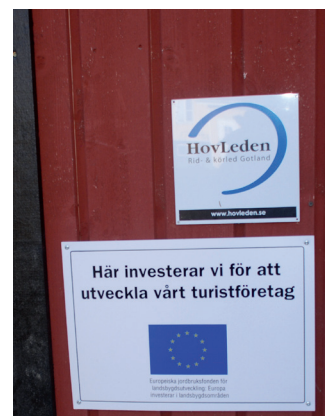
Än så länge finns vissa möjligheter att få stöd inom Landsbygdsprogrammet.

Är du primärproducent inom jordbruket finns det ännu vissa möjligheter att få stöd för investeringar och även till etablering i företag (startstöd). Har du fått stöd tidigare inom den här programperioden har du generellt mindre chans än andra att få ytterligare stöd nu.